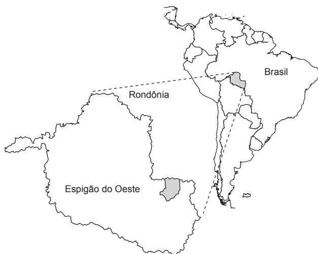
Figura 1. Mapa da América do Sul com a localização de Espigão do Oeste (RO) - Brasil.

O estudo foi realizado entre fevereiro de 2001 e março de 2002, na Fazenda Jaburi (11° 35' - 11° 38' S e 60° 41' - 60° 45' W), Município de Espigão do Oeste (RO) (Figura 1). A região encontra-se no