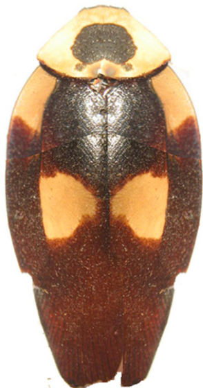
Figura 6. Eushelfordia amazonensis (Rocha e Silva-Albuquerque 1957): holótipo macho, Habitus, dorsal.