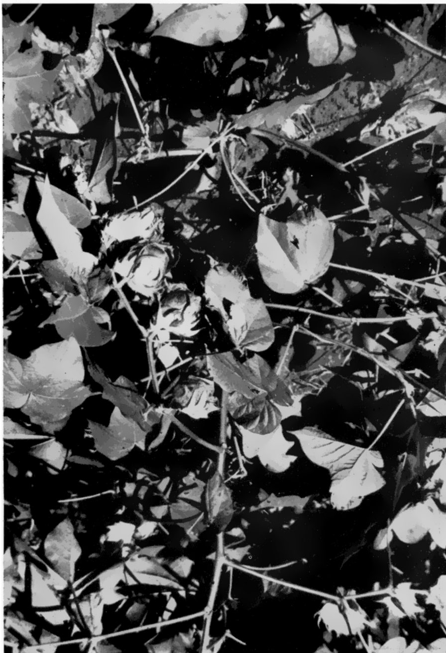
FIGURA 1. — Detalhe de uma planta (Tn-1) de frutos pendentes, fenótipo P. Nota-se a tendência lateral dos pedúnculos. Na abertura, a ponta dos frutos acaba virando-se para o solo. Nessas plantas notou-se a ocorrência de um ou outro fruto em posição ereta.