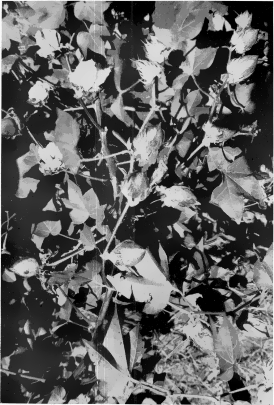
FIGURA 2. — Detalhe de uma planta tipo Upland, fenótipo E. Os frutos, eretos, se dispõem em ziguezague, posição que conservam até o fim do ciclo. Um ou outro fruto pode assumir, nessas plantas, uma posição pendente, principalmente dentre os que apresentam pedúnculos compridos.