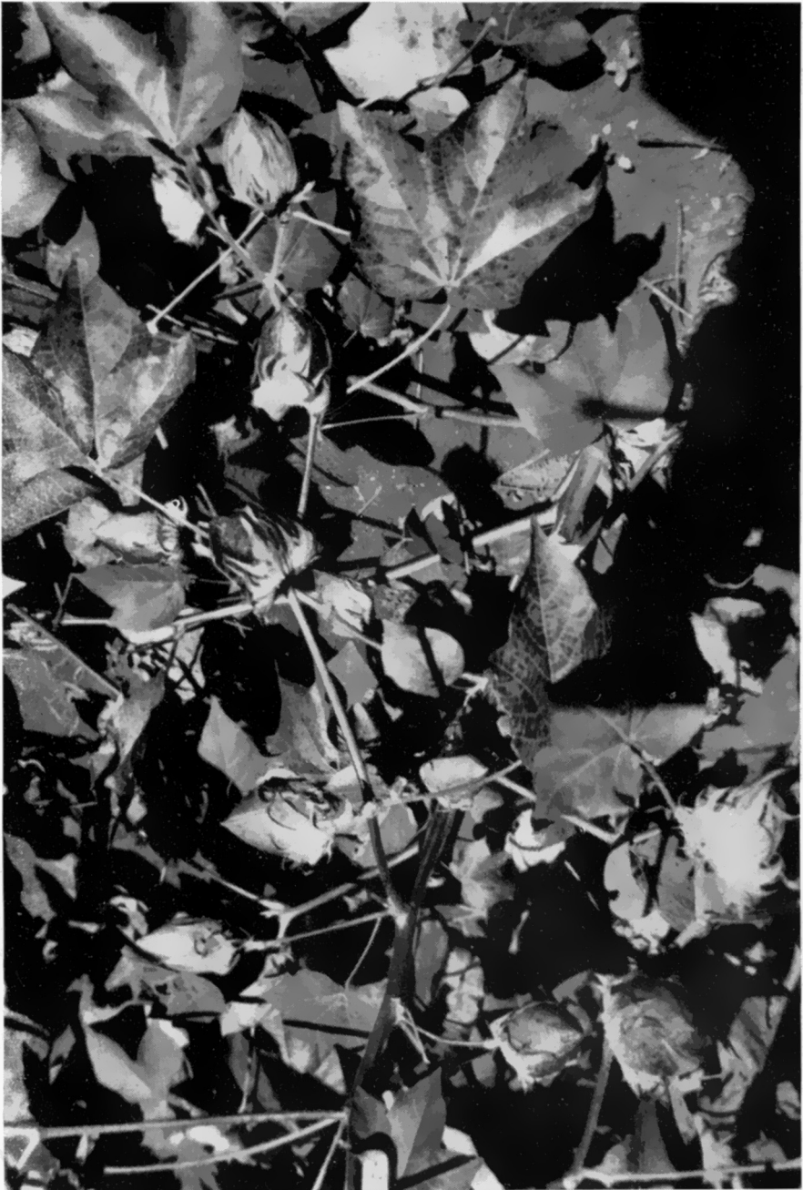
FIGURA 3. — Detalhe de uma planta híbrida, de fenótipo I. Parte dos frutos tem uma posição lateral ou pendente, enquanto que a outra parte permanece ereta. A variação pode ocorrer dentro do mesmo ramo frutífero como também entre ramos, aparecendo na mesma planta ramos frutíferos com frutos pendentes e outros com frutos eretos.