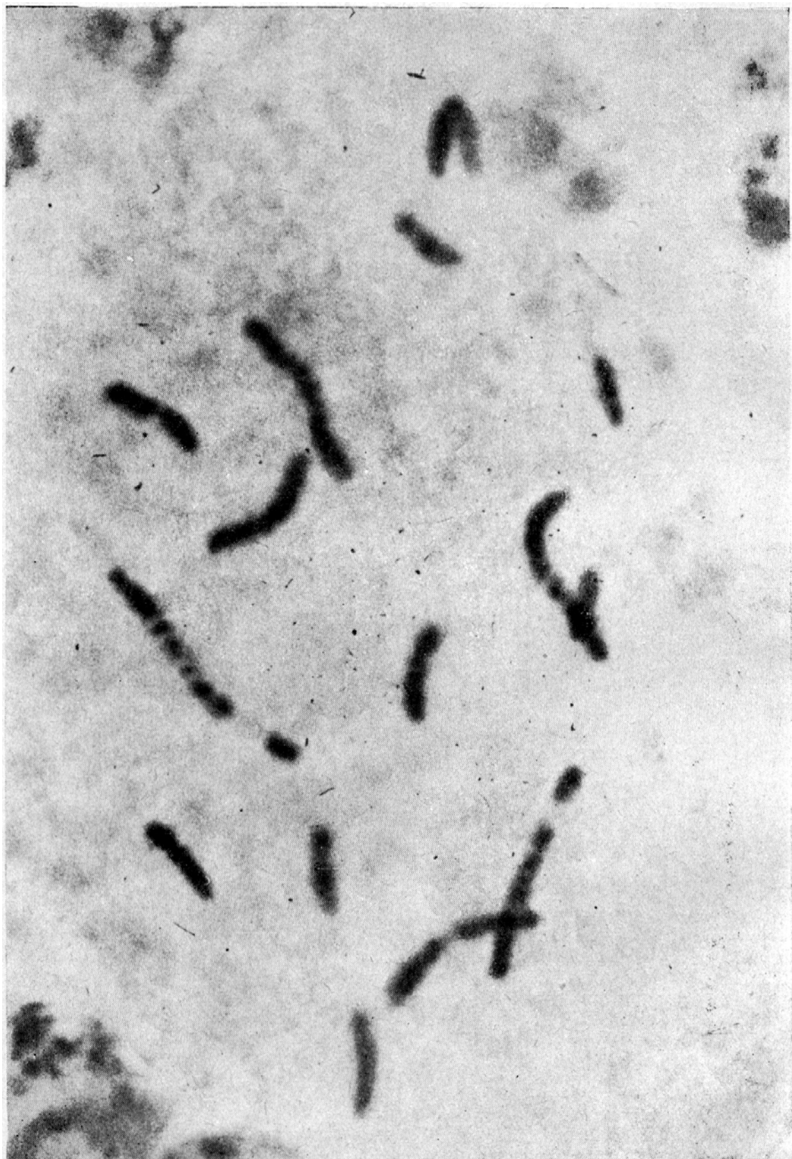
Prófase em tecido do embrião. Ampliação da figura B da estampa 1. Contam-se somente quinze cromossômios, pelo fato de se ter perdido um deles, com o esmagamento do tecido. 4 350 X.