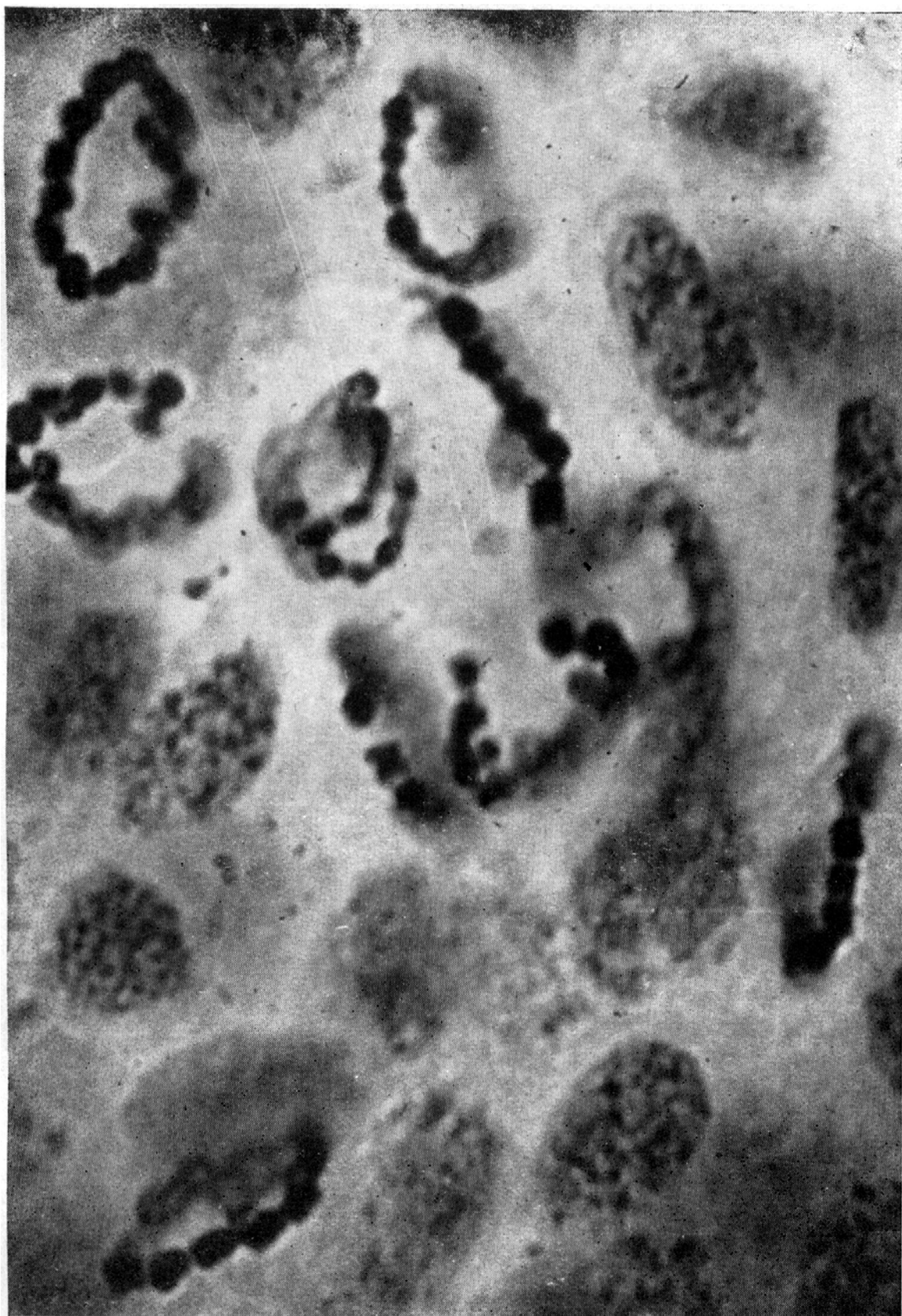
Espermatogônios com cromossômios em cadeia anular. Em algumas células os cromossômios já se acham fendidos longitudinalmente. 3 800 ×.