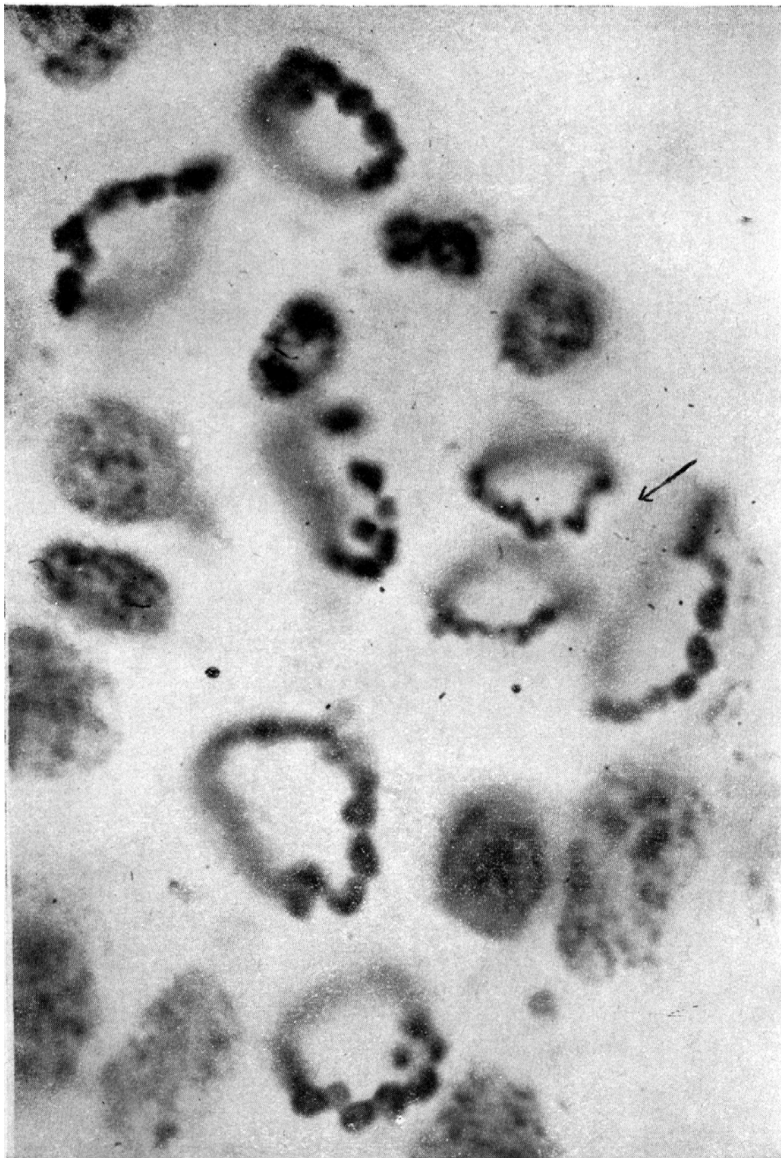
Espermatogônios com cromossômios em cadeia anular. Acha-se assinalada uma célula em anáfase adiantada, onde se nota que os cromossômios caminham para os pólos ainda ligados entre si, alguns deles encurvados e com suas extremidades voltadas para o pólo para onde se dirigem. 3 800 ×.