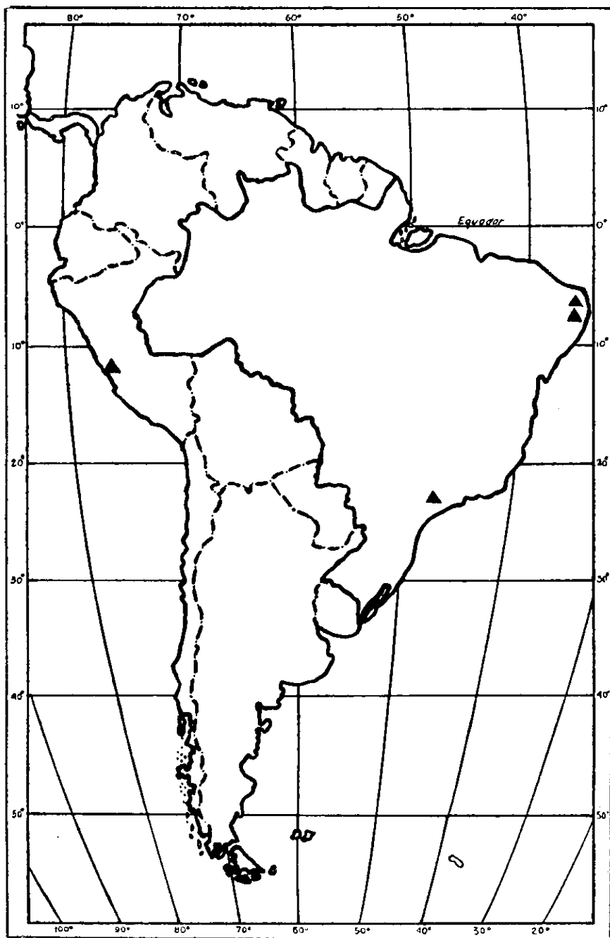
FIGURA 2. — Mapa mostrando a distribuição da Murcha do algodoeiro causada por Fusarium oxysporum f. vasinfectum , no continente sul-americano.