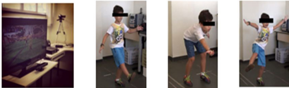
Figura 2. Imagens da sala montada e da criança realizando a intervenção.

Nota: *Percentil/Escore padronizado; A1 = um mês antes da intervenção, B = período de intervenção, A2 =um mês sem intervenção.