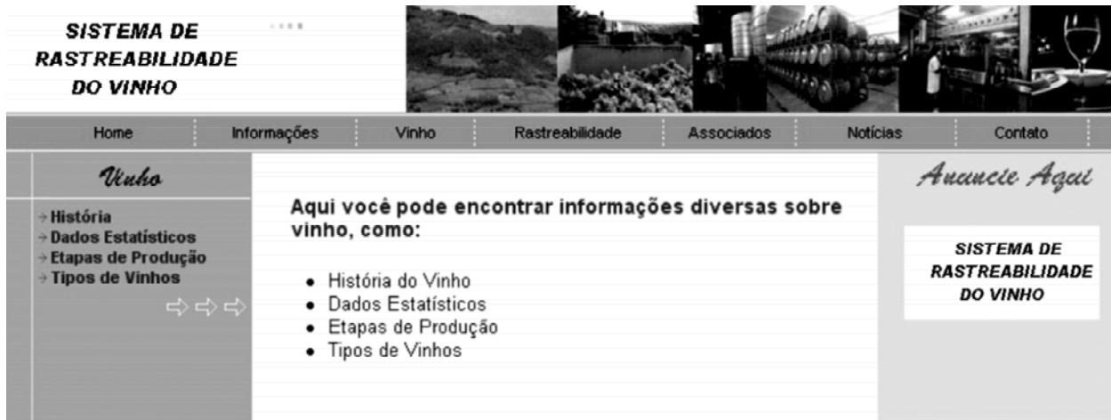
FIGURA 3 – Página com as opções de menu para seleção de informações sobre o vinho.