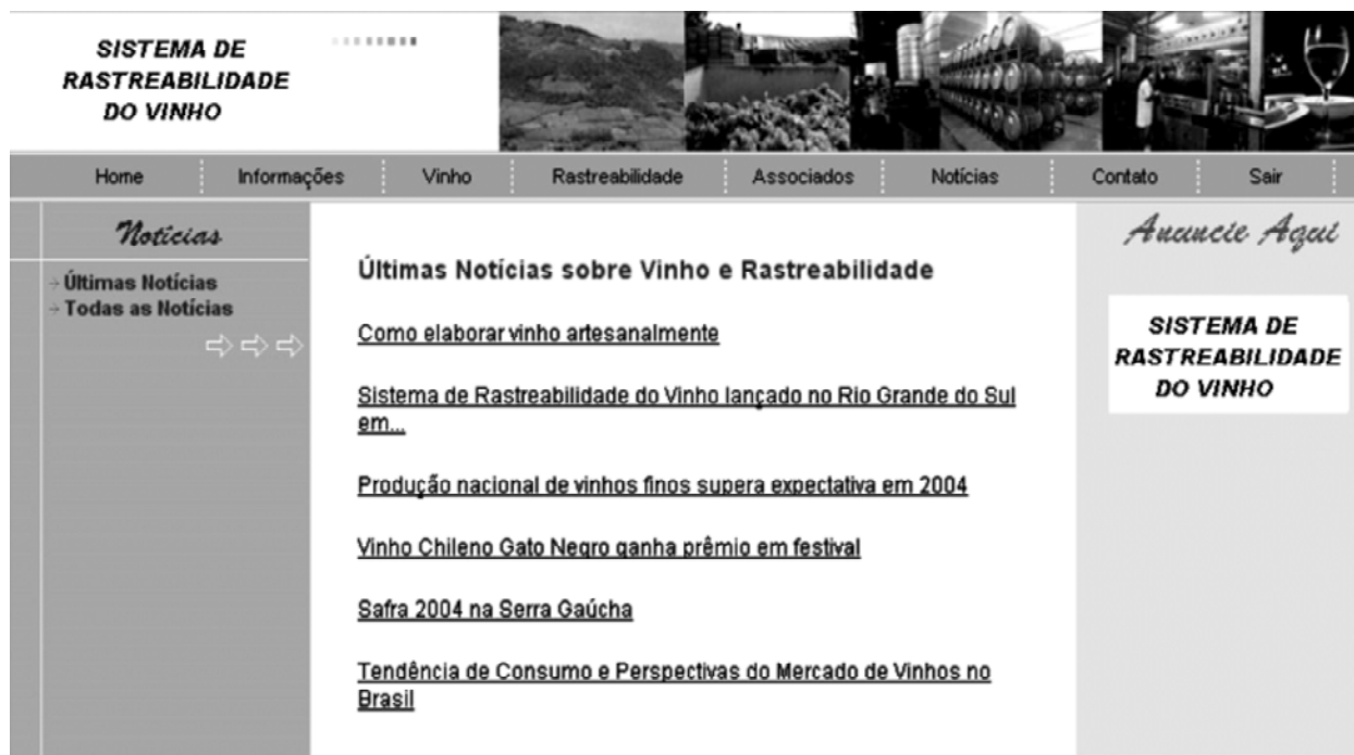
FIGURA 5 – Página com as opções para notícias sobre vinho e rastreabilidade.

Para poder rastrear um vinho, é necessário informar apenas o ano da safra e o código do vinho. Ambos os dados deverão ser estampados no rótulo da garrafa. Na Figura 6 é mostrada a página referente a esta opção.