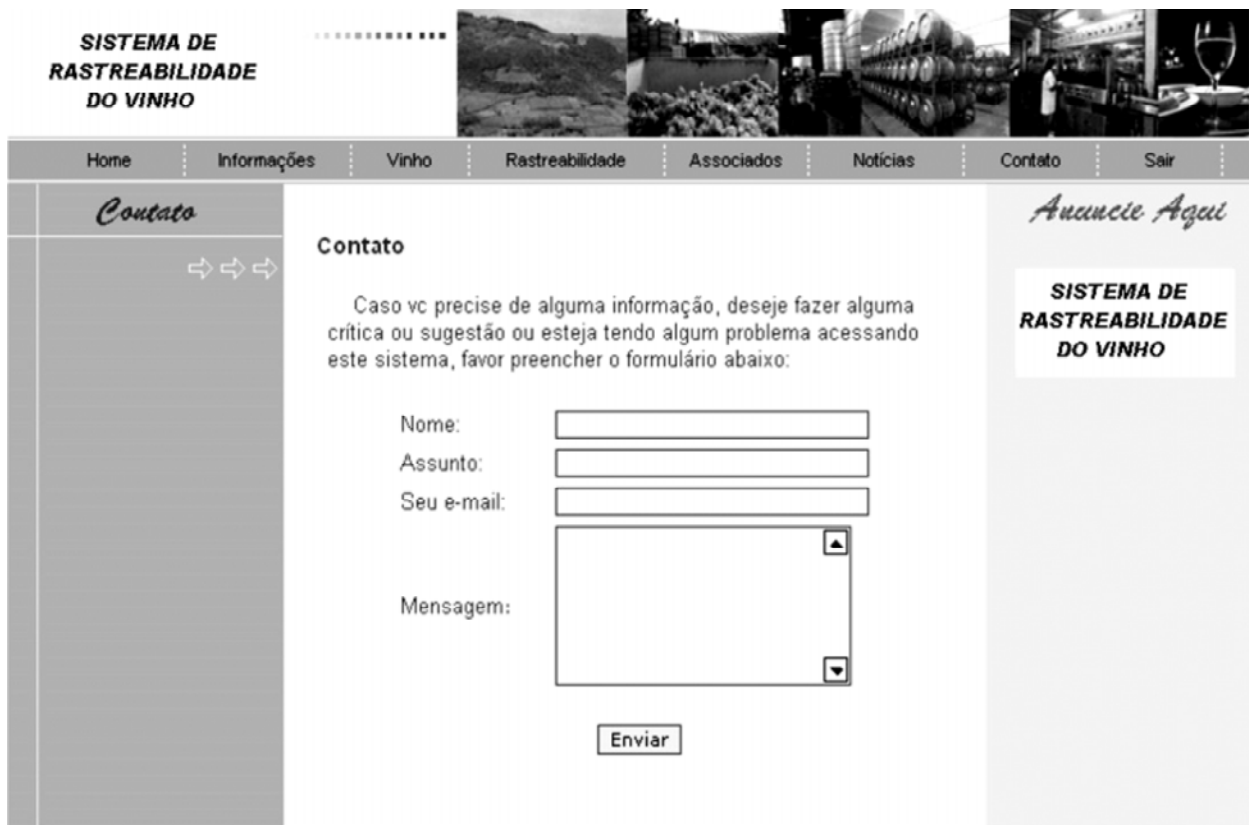
FIGURA 4 – Página “Contato”, onde se pode enviar uma mensagem.