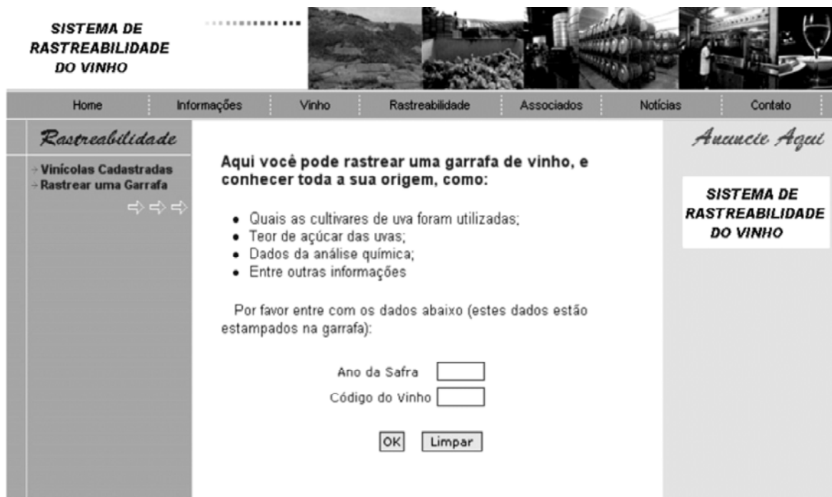
FIGURA 6 – Página onde se deve entrar com os dados de uma garrafa de vinho a ser rastreado.