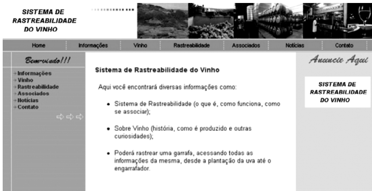
FIGURA 1 – Página principal do sistema.