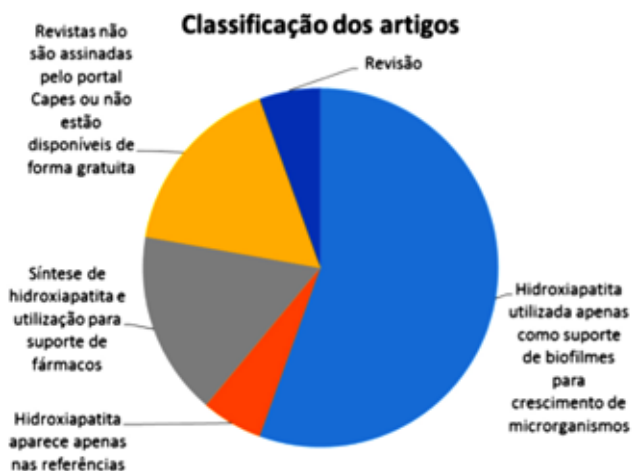
Figura 2: Classificação dos artigos. [Figure 2: Classification of articles.]

visão dos microrganismos que foram testados. Dentre os microrganismos mais testados, ganha destaque a bactéria Gram-positiva Streptococcus Mutans , uma espécie de bactéria que age como microrganismo pioneiro que dá suporte para formação da placa bacteriana oportunizando