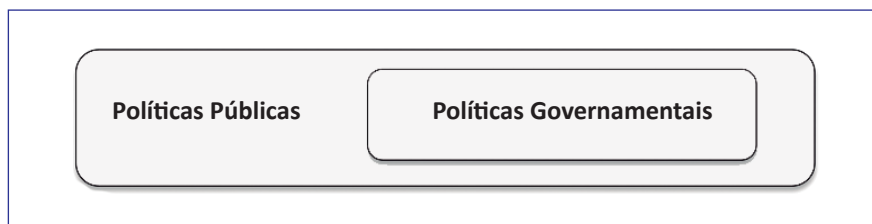
Figura 1 Políticas públicas e políticas governamentais