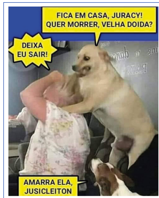
Figura 2 Meme sobre os idosos na pandemia

Da mesma forma, embora com o objetivo de entreter aqueles que os consomem, os memes coletados ao longo desta pesquisa retratam os idosos em uma condição de confinamento forçado induzido por outras pessoas. Esses artefatos culturais (memes) desconsideram a independência conquistada pelos idosos. Por exemplo, a figura 1 mostra uma senhora sendo impedida de sair por seu cachorro, que diz: ‘Fique em casa. Você quer morrer, velha louca?’. Tal texto revela uma autonomia frágil, cuja suspensão pode ocorrer a qualquer momento socialmente autorizado, e expõe a condição de vulnerabilidade do idoso sob o olhar de outrem.