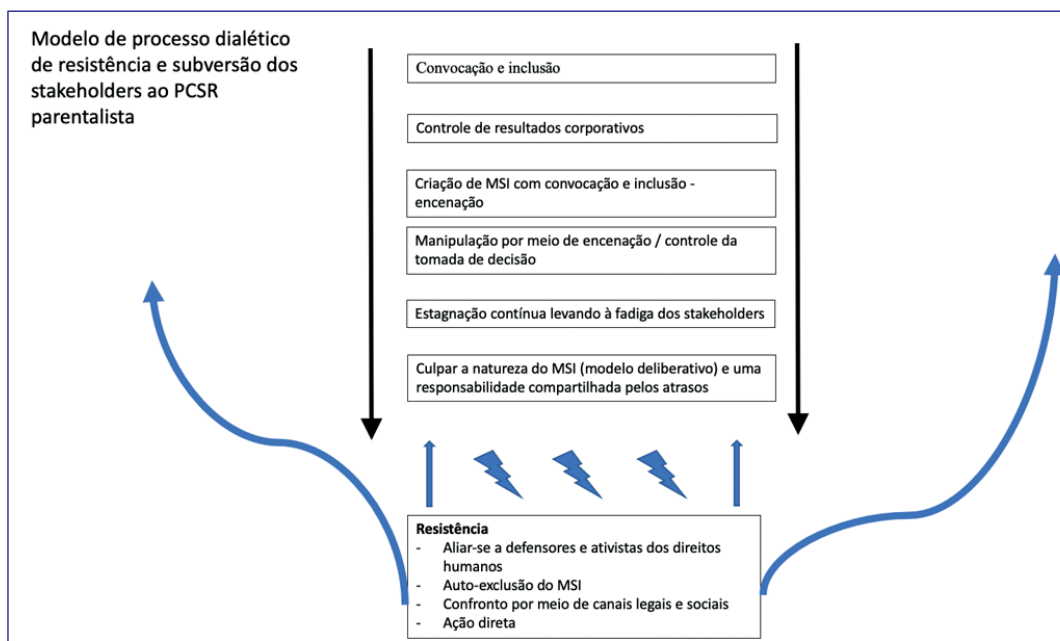
Figura 2 Modelo de processo dialético de resistência e subversão dos stakeholders ao PCSR parentalista