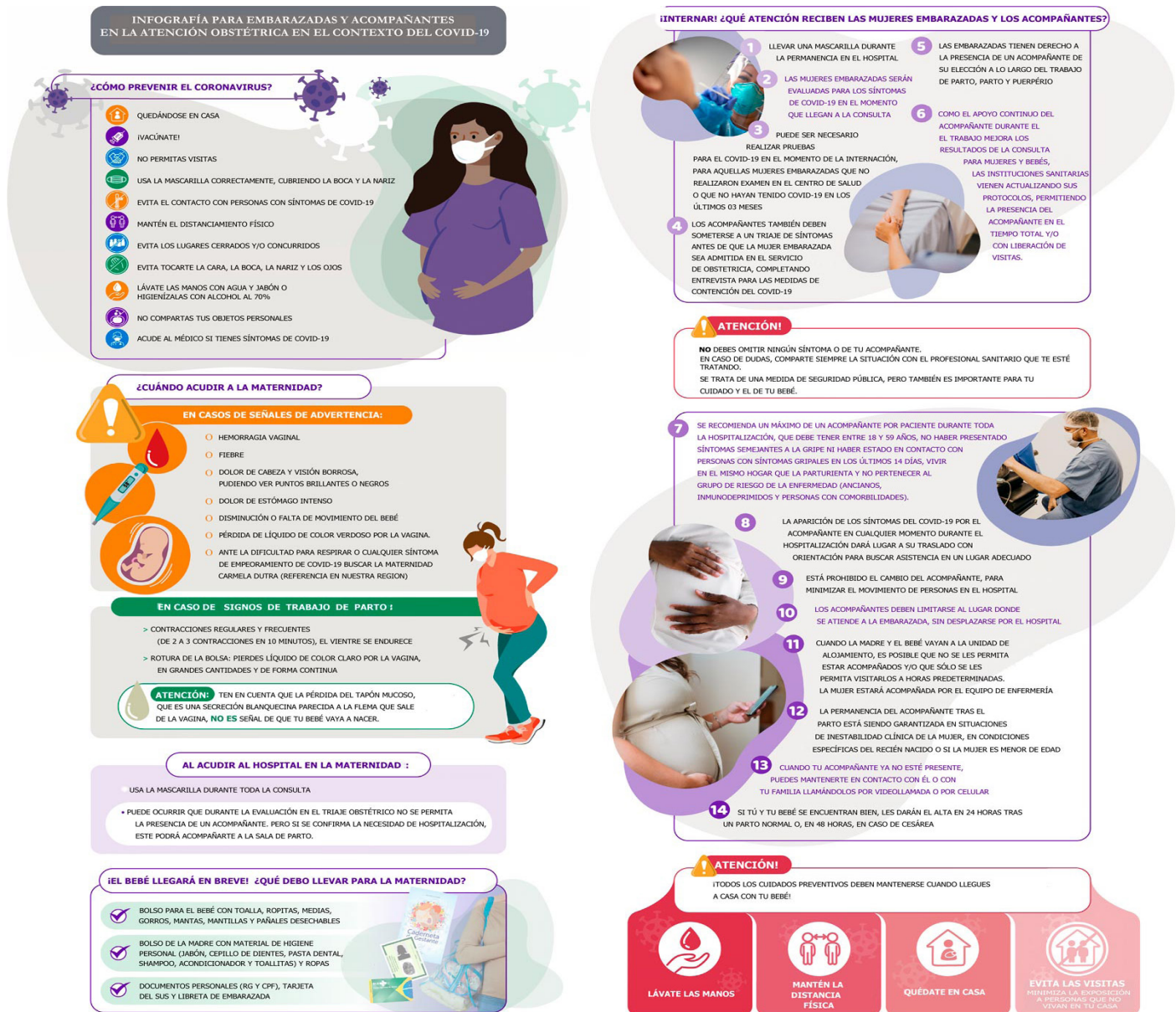
Figura 1 - Infografía para embarazadas y acompañantes en la atención obstétrica en el contexto de Covid-19. Florianópolis, SC, Brasil, 2022

hospitalización; e información sobre el alta durante la pandemia Covid-19. Además de abordar las necesidades de orientación detectadas en la práctica de las enfermeras, la infografía presenta la información de forma dinámica y atractiva, facilitando la comprensión de las embarazadas y sus acompañantes.