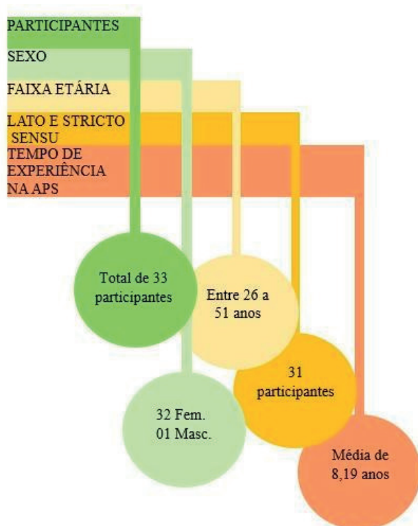
Figura 1 – Caracterização dos participantes. Chapecó, SC, Brasil, 2023

Serão apresentados o perfil sociodemográfico, as análises frequências e os DSC. Na Figura 1, há o perfil dos participantes caracterizados a partir da idade, do sexo, da formação continuada e da experiência profissional.