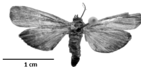
FIGURA 2: Vista dorsal de adulto de Hypsipyla ferrealis .

A predação de sementes por insetos implica em danos diretos na qualidade das sementes e pode alterar a regeneração das espécies, visto que as sementes predadas têm seu potencial de germinação reduzido (CRAWLEY e GILLMAN, 1989; PINTO, 2007). Além disso, a predação de sementes pode comprometer diretamente a produção de óleo, em função das perdas quantitativas de sementes e, indiretamente, diminuindo a qualidade do óleo produzido (LIMA, 2010).