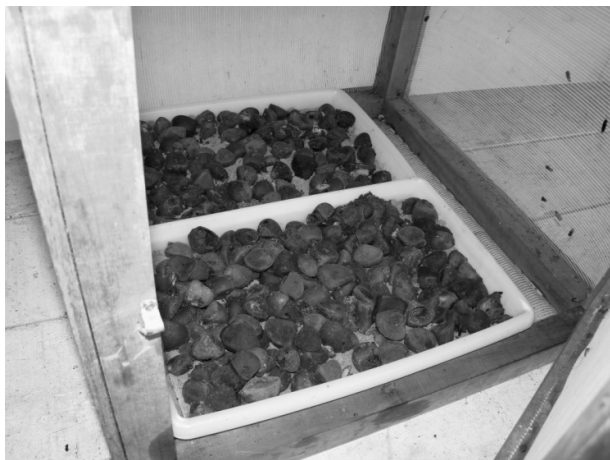
FIGURA 1: Sementes de andiroba dispostas em bandejas plásticas contendo areia umedecida e acondicionadas no interior de gaiola telada.

Sementes de andiroba broqueadas foram encaminhadas até o Laboratório de Entomologia da Embrapa Acre, a fim de se determinar o agente causador dos danos. As sementes foram coletadas no mês de junho de 2013, provenientes de 10 andirobeiras de ocorrência natural em terra firme e com altura aproximada de 12 m. As árvores estavam localizadas na bordadura de um remanescente florestal, na propriedade Bom Sucesso, localizada no município de Senador Guiomard - AC (67°48'26.35"S; 10°06'31.67"W).