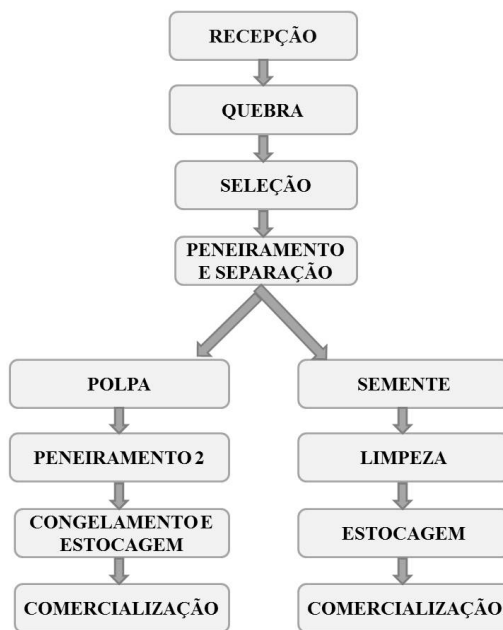
FIGURA 2: Fluxograma com as etapas envolvidas no processamento dos frutos de Jatobá.