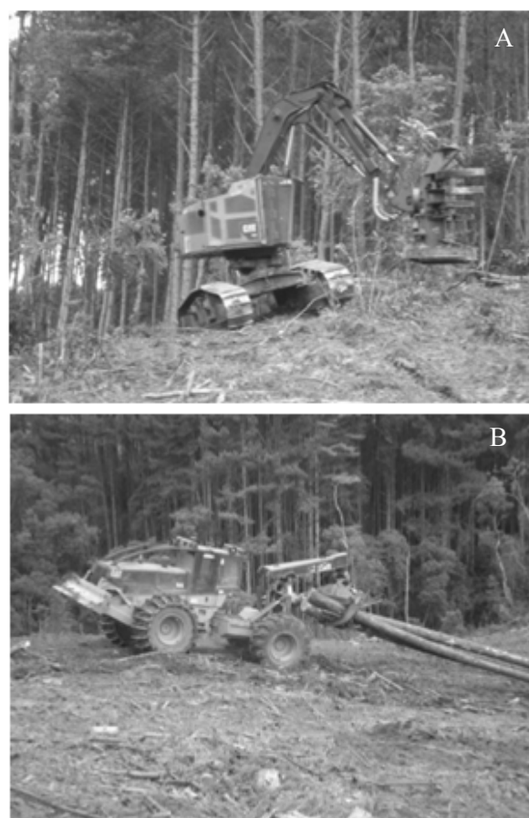
FIGURA 1: Feller Buncher CAT 522 (a) e Skidder CAT 545 avaliados no estudo.

O feller buncher estudado era da marca Caterpillar , modelo 522, motor Caterpillar C9 ACERT, com potência nominal de 193 kw, rodados de esteiras e peso operacional de 30,4 t, equipado com cabeçote da marca Caterpillar , modelo HF 201, área útil de corte de 4,60 m 2 e capacidade de carga de 2.517 kg. O skidder era da marca Caterpillar , modelo 545, motor Caterpillar 3306 DITA, potência nominal de 163 kw, tração de 4X4, rodados de pneus recobertos com semiesteiras da marca Eco Wheel Track na parte dianteira, garra com área útil