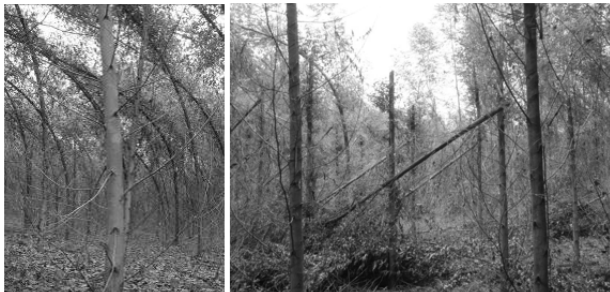
FIGURA 1: Plantios clonais de eucalipto afetados pelo vento na região do Vale do Rio Doce, Minas Gerais.

Os ventos que causam danos às plantações brasileiras geralmente ocorrem associados a fortes tempestades e em estações chuvosas, estando os maiores prejuízos concentrados entre os meses de novembro e março, época em que o solo está mais saturado de água, e, conseqüentemente, as raízes têm um poder de fixação menos efetivo (ROSADO, 2006). As árvores que possuem aproximadamente 24 meses de idade são as mais afetadas, pela condição de que alcançaram um estágio de crescimento (relação copa/tronco) em que estão mais vulneráveis aos efeitos maléficos das condições ambientais.