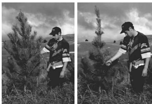
FIGURA 4: Aplicação do tratamento silvicultural denominado “wind proofing” em árvore de Pinus radiata aos dois anos de idade: antes da retirada dos ramos (à esquerda) e após a retirada dos ramos (à direita) (DAVIES-COLLEY e TURNER, 2001).

FIGURE 4: Application of silvicultural treatment termed “wind proofing” in Pinus radiata tree at two years old: before the removal of branches (left) and after removal of branches (right) (Davies-Colley and TURNER, 2001).