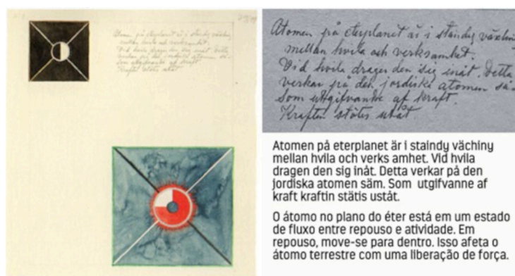
Figura 3 – Aquarela n. 8 da série Átomos , com destaque para o texto que compõe a obra, traduzido para o português