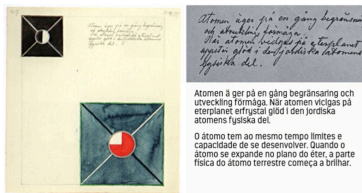
Figura 2 – Aquarela n. 7 da série Átomos , com destaque para o texto que compõe a obra traduzido para o português