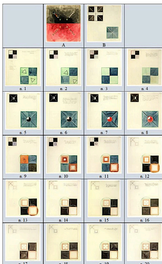
Quadro 1 – Conjunto de aquarelas da série Átomos , de Hilma af Klint, realizadas em 1917

Na comunicação considera-se o signo, sua articulação a este contexto e sua composição. Para van Leeuwen (2005, p. 179, tradução nossa), a “[...] composição fornece coerência e estrutura significativa a arranjos espaciais”. A composição refere-se à disposição dos elementos visuais – pessoas, coisas, cores, objetos etc. – no espaço, bem como ao modo em que se articulam para produzir mensagens e contemplação estética (VAN LEEUWEN, 2005). Buscou-se, então, tecer reflexões sobre essas representações artísticas criadas por Hilma af Klint com base na composição visual e disposição dos elementos constituintes das obras ( quadro 1 ). Tal caracterização visual fornece informações para a interpretação das representações artísticas, as quais dão pistas para se traçar aproximações com a ciência.