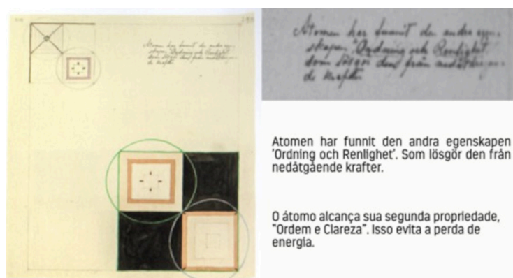
Figura 4 – Aquarela n. 15 da série Átomos