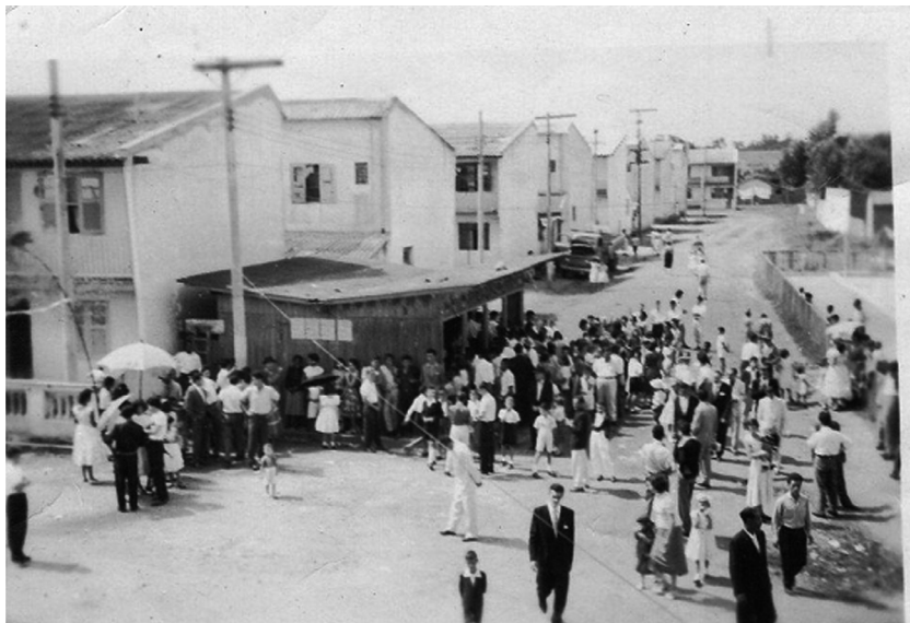
Foto 1. Vila Popular durante confraternização da década de 60.

Os sobrados tinham originalmente 3,75m por 10m e quintal de 16m 2 , dois quartos e banheiro na parte superior e sala cozinha e quintal na parte inferior. Hoje alguns foram alterados e outros completamente demolidos para a construção de uma nova casa, porém no mesmo lote. A vila foi projetada originalmente para operários da região, mas muitos ferroviários se instalaram lá. Em sua composição original, podemos perceber o fenômeno da migração interna, pois muitos dos moradores vieram do interior de São Paulo, atraídos pela oportunidade de emprego das indústrias do ABC e também devido à crise cafeeira. 1