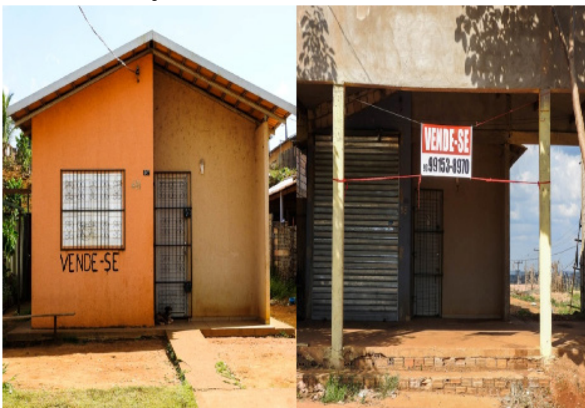
Figura 3 – Residências nos reassentamentos urbanos

Em tal contexto, o território fica à mercê do estado e da empresa, em uma gestão falha, a qual impulsiona a disputa pelo território, violando o direito de ir e vir, o direito de uma vida comunitária, bem como, o “direito à cidade” (Lefebvre 2008), resultando na reclusão social dos sujeitos dentro de suas residências ou até mesmo no abandono delas, como foi possível presenciar no decorrer da pesquisa, em que um grande número de casas estão à venda ou simplesmente abandonadas, consequência da violência e aumento do custo de vida aos reassentados, conforme foi relatado pelos entrevistados, pelos vizinhos ou conhecidos.