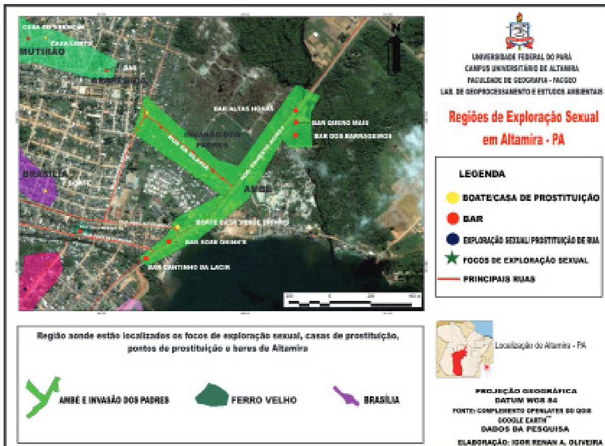
Figura 1 – Regiões de exploração sexual