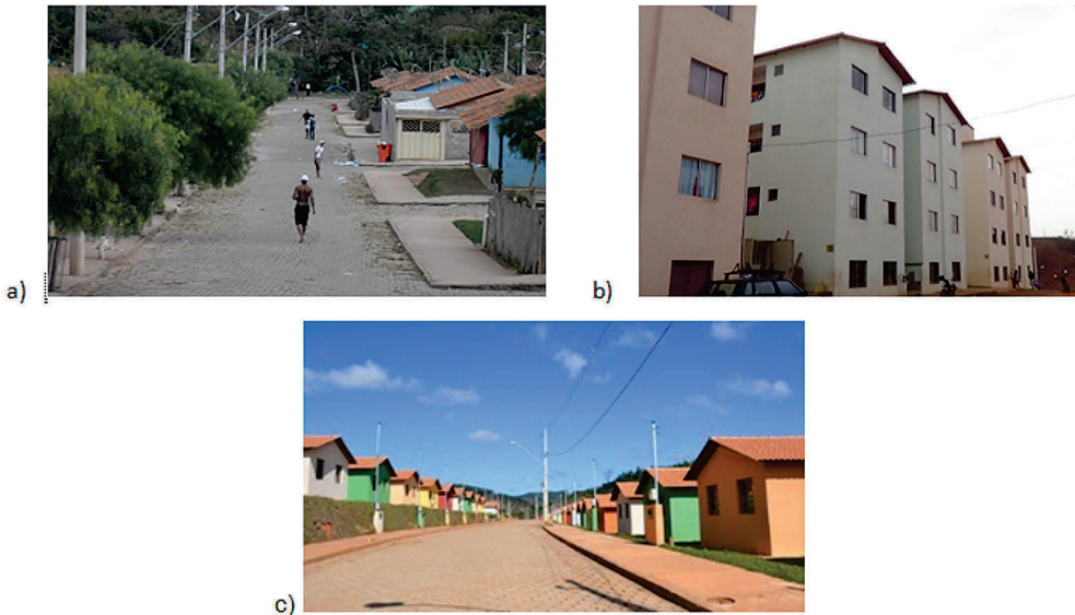
Figura 2 – Vista dos conjuntos habitacionais: a) Benjamin José Cardoso; b) Floresta. Viçosa; c) César Santana Filho – Viçosa, MG, 2011