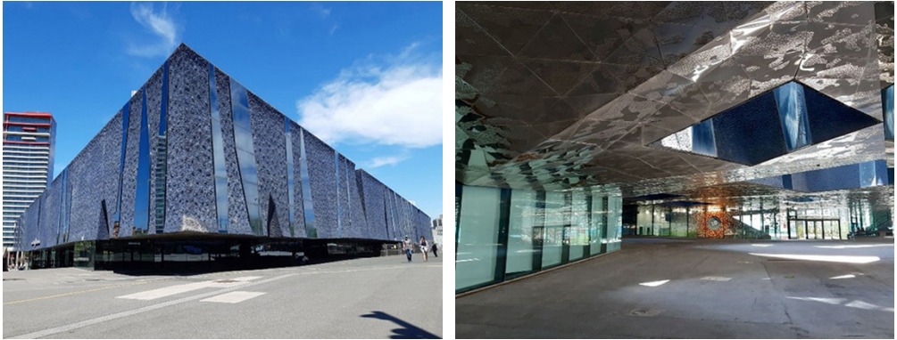
Figura 5 – Edifici Blau (Edificio Azul) desde las perspectivas exterior e interior. Recinto Fórum de las Culturas, Barcelona