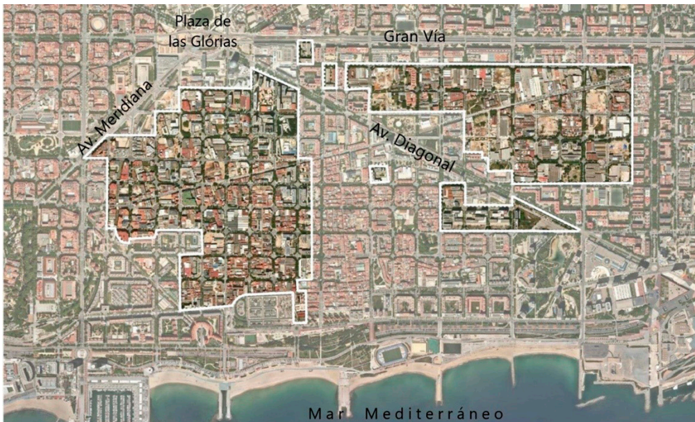
Figura 2 – Situación del Distrito 22@ Barcelona