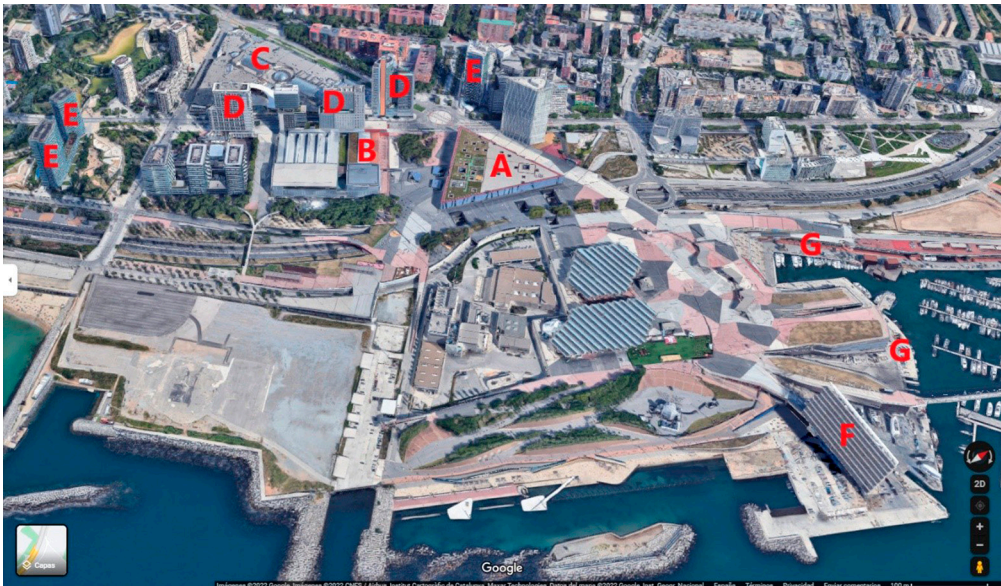
Figura 4 – Organización espacial del Fórum Universal de las Culturas y su entorno