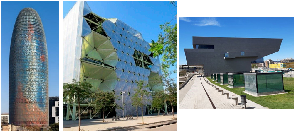
Figura 3 – Edificios singulares: Torre Glòries, Media-TIC y Disseny Hub Barcelona (de izquierda a derecha)