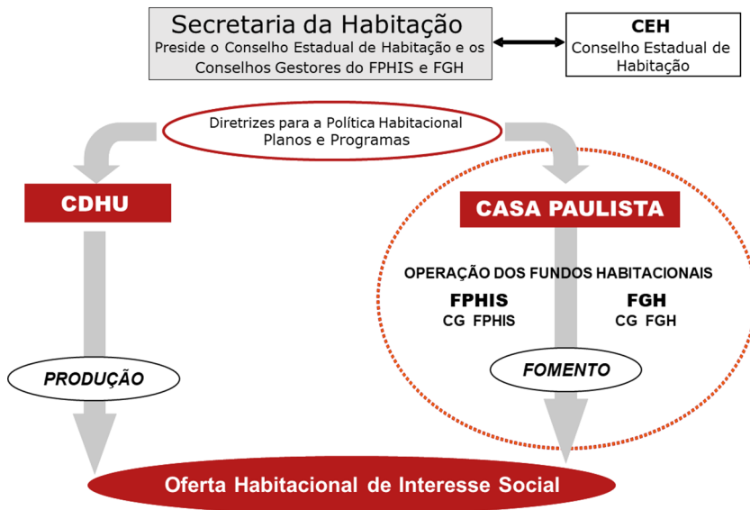
Figura 1 – Estrutura governamental paulista – Setor de habitação popular