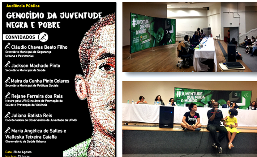
Figura 7 – Escuta pública no Centro de Referência da Juventude de BH em 28/8/2017