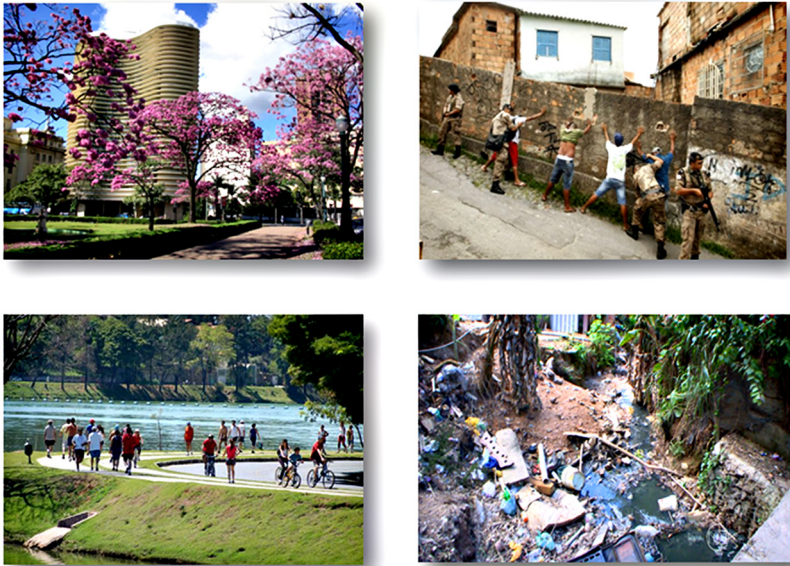
Figura 5 – “A cidade ideal poderia ser uma que fornecesse uma boa qualidade de vida a toda população independentemente de classes sociais, raça ou opção sexual” (Grupo A)

Imagens montadas para a disciplina.