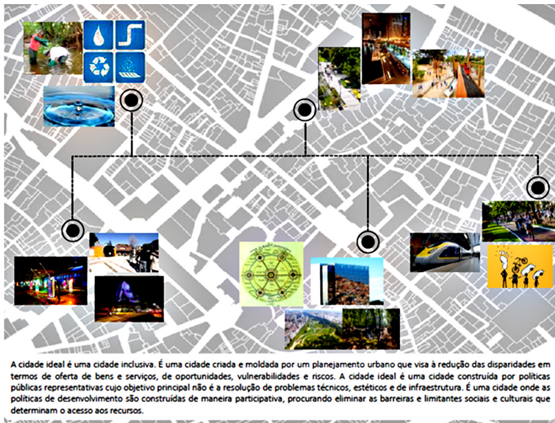
Figura 6 – Pontos percorridos, com identificação de aspectos presentes na cidade real em comparação com os aspectos de uma cidade ideal

A cidade ideal é uma cidade inclusiva. É uma cidade criada e moldada por um planejamento urbano que visa à redução das disparidades em termos de oferta de bens e serviços, de oportunidades, vulnerabilidades e riscos. A cidade ideal é uma cidade construída por políticas públicas representativas cujo objetivo principal não é a resolução de problemas técnicos, estéticos e de infraestrutura. É uma cidade onde as políticas de desenvolvimento são construídas de maneira participativa, procurando eliminar as barreiras e limitantes sociais e culturais que determinam o acesso aos recursos.