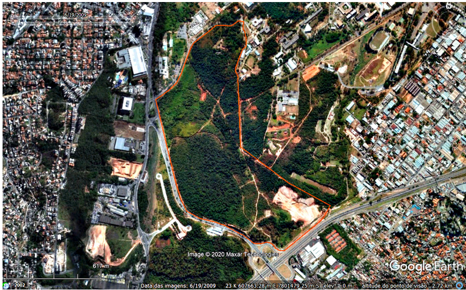
Figura 1 – Estação Ecológica da Universidade Federal de Minas Gerais, Belo Horizonte, MG

Imagem aérea, altitude do ponto de visão = 3,94 km. Limite da E.E. – UFMG. Perímetro 4,36 km e área 0,79 km 2 .