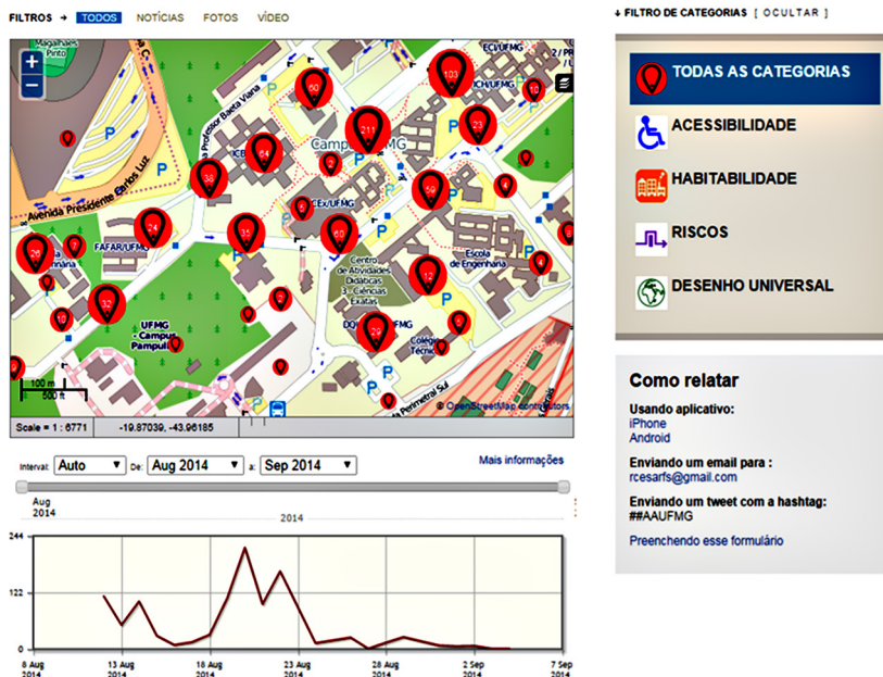
Figura 3 – Interface de ferramentas na área de trabalho para avaliação ambiental