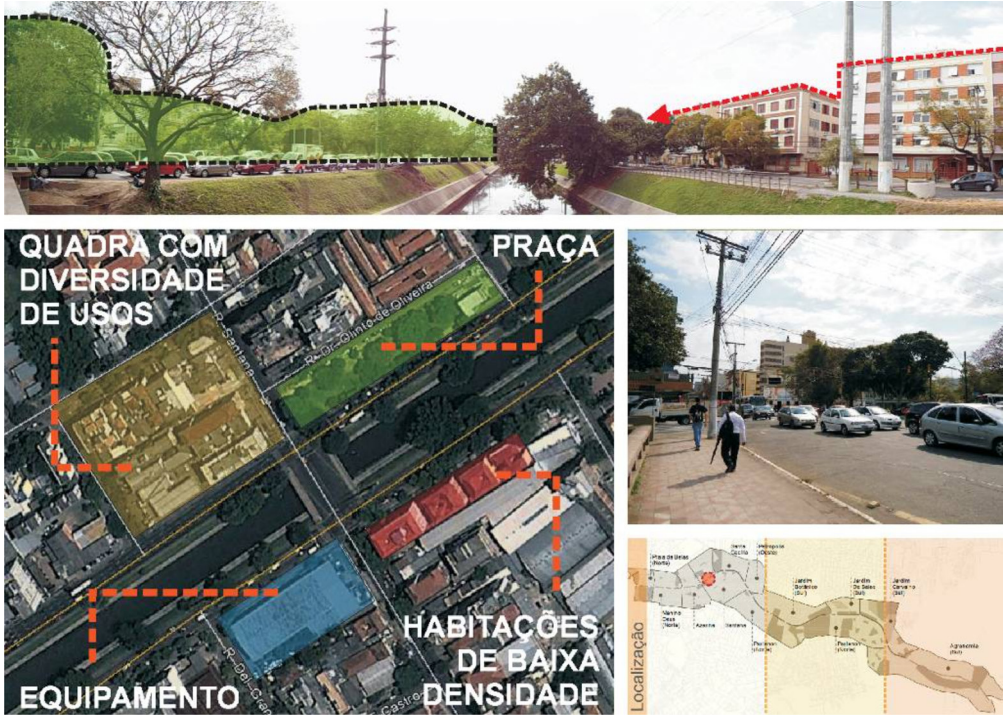
Figura 5 – Ponto focal do trecho 1 Cruzamento com a Rua Santana