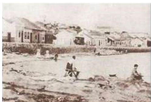
Figura 3 – Imagens do Arroio Dilúvio, referente às primeiras décadas do século XX

Naquele período, o Dilúvio estava presente no cotidiano das pessoas do entorno garantindo o direito de acesso à água através de várias ações em que o arroio era o cenário conforme a Figura 3. A primeira imagem mostra o casario como pano de fundo das atividades realizadas no curso de água como pesca e banho e na segunda a importância da Ponte de Pedra como ícone de conexão urbana da época.