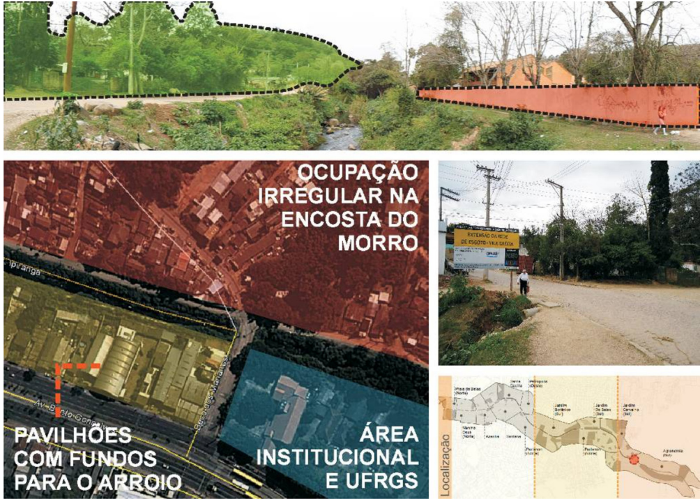
Figura 7 – Ponto focal do trecho 3 Cruzamento com o Beco dos Marianos