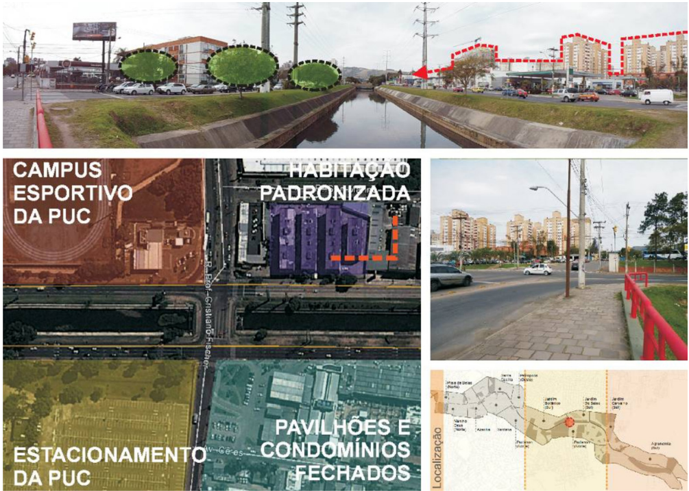
Figura 6 – Ponto focal do trecho 2 Cruzamento com a Avenida Cristiano Fischer