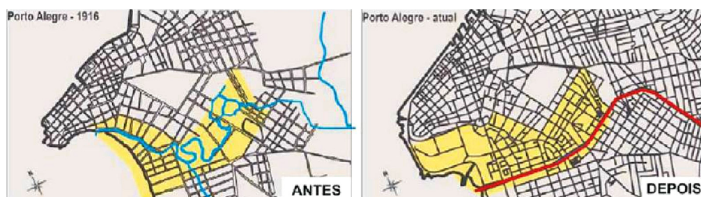
Figura 2 – A canalização do arroio Dilúvio em Porto Alegre

De fato, o processo de urbanização da bacia ao longo do século XX veio atrelado ao crescente embate da sociedade com as águas de seu território. Conforme Burin (2008), por volta de 1900, medidas começaram a ser tomadas para conter o problema das enchentes. Desde então, diversas pesquisas foram realizadas e, devido ao crescimento populacional de Porto Alegre entre 1912 e 1914, um grande estudo foi realizado, baseado no que já estava sendo feito na época em São Paulo e Rio de Janeiro. Dentre essas ações, surgiu o projeto concreto para a retificação do Riacho, compreendido no Plano de Urbanização de Porto Alegre em 1943. Assim, deu-se início às obras de construção da Avenida Ipiranga e retificação do Arroio Dilúvio, que, por sua vez, só foram finalizadas na década de 1980, esquetizadas na Figura 2.