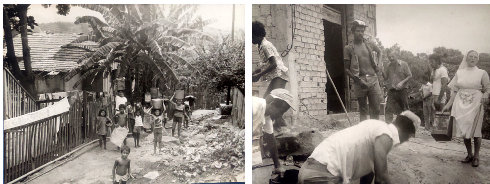
Figura 2 – Crianças auxiliando mutirão no MBV e Mutirão para construção de igreja

abandonado à medida que os moradores instalavam fossas sépticas, ou em uma torneira pública fornecida gratuitamente pela companhia municipal de abastecimento de água fora do morro em área adjacente a ele, no chamado Beco da Água. Esta era coletada em latões e levada morro acima a pé sobre as rochas nuas, sem auxílio de escadas ou corrimões durante o trajeto. A Figura 2 mostra crianças carregando água para os eventuais mutirões em prol da melhoria da comunidade e revela algumas características do local. A rua sem calçamento, mas, possivelmente, com energia elétrica e água encanada, visto o poste fixado ao solo à direita da imagem e o encanamento ao longo das cercas das moradias ou cruzando o caminho. O único registro fotográfico de um mutirão (à direita), possível de recuperação, foi o da construção da primeira igreja católica local, contudo sem data exata.