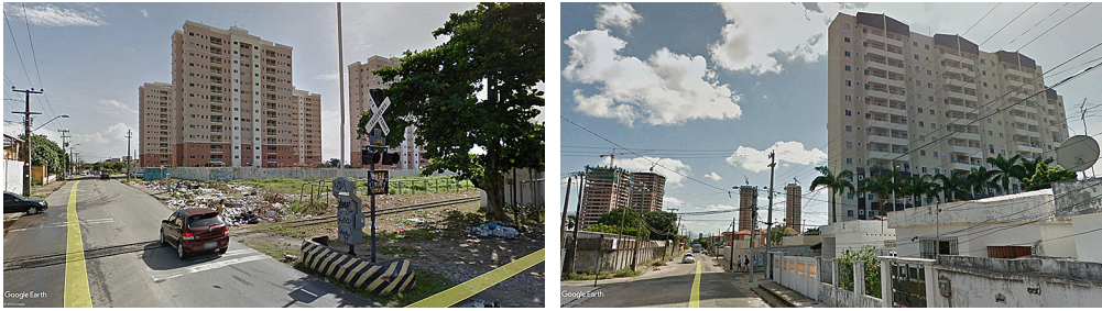
Figura 5 – Exemplos de condomínios residenciais na área de estudo