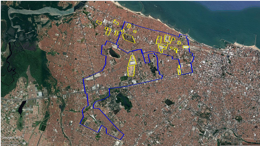
Figura 4 – Relação espacial vazios urbanos (amarelo) e OUCs previstas (azul)