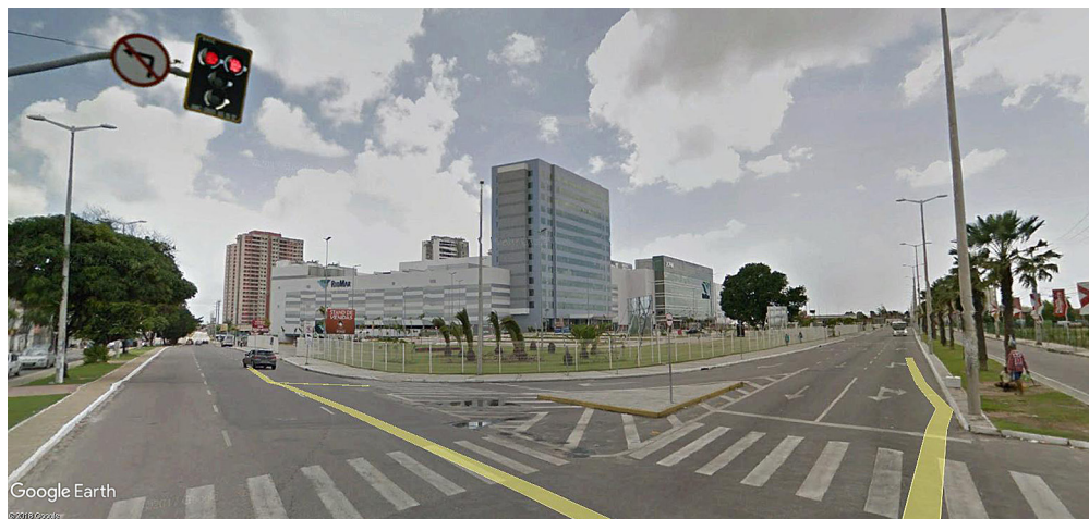
Figura 8 – RioMar Kennedy (frente) e Boulevard Shopping Residence (fundo)