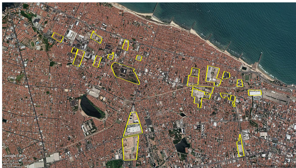
Figura 6 – Espacialização dos vazios urbanos industriais identificados