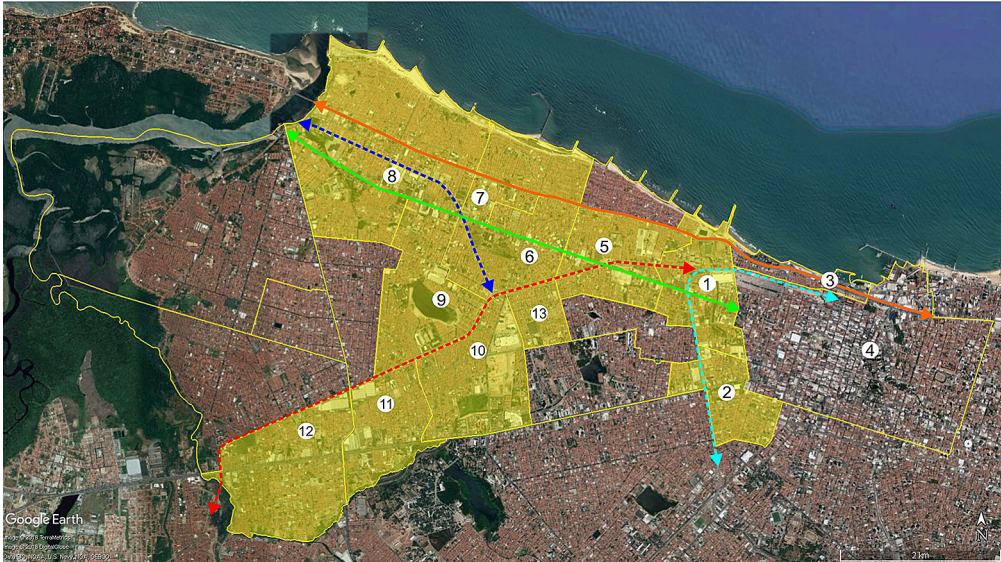
Figura 3 - Abrangência da periferia industrial oeste na segunda metade do século XX (divisão atual dos bairros em amarelo) e eixos de estruturação