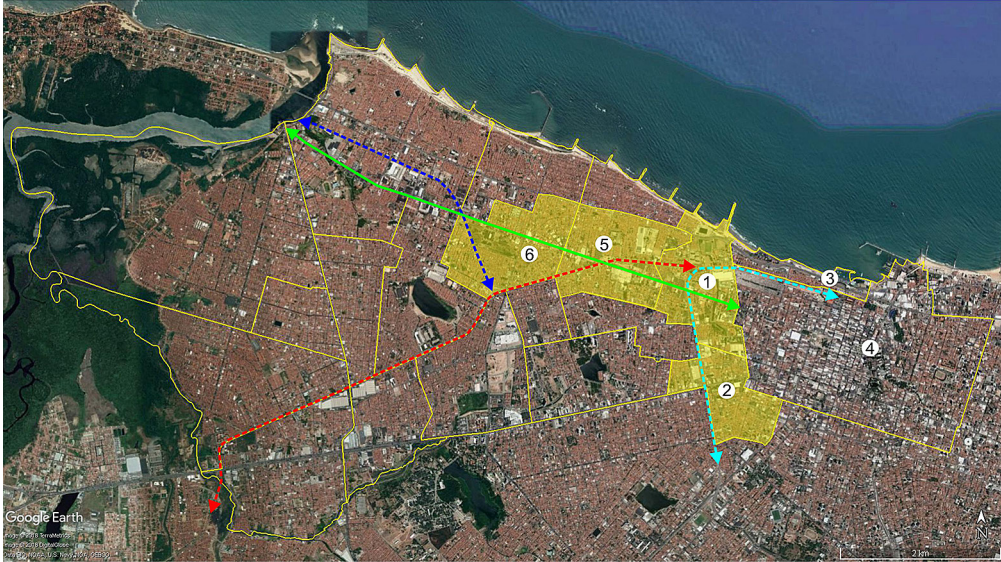
Figura 2 - Abrangência da periferia industrial oeste na primeira metade do século XX (divisão atual dos bairros em amarelo) e eixos de estruturação