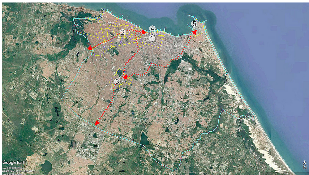
Figura 1 – Periferias industriais e áreas portuárias em Fortaleza