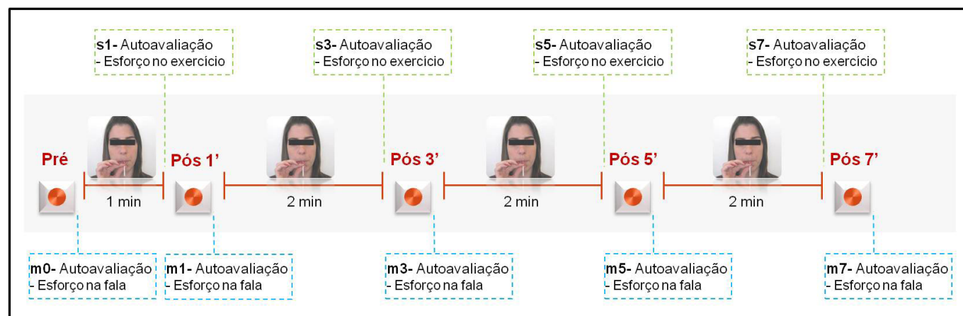
Legenda: = gravação das amostras de fala; = realização do exercício; min = minuto; m0 = pré-exercício; m1 = após 1 minuto; m3 = após 3 minutos; m5 = após 5 minutos; m7 = após 7 minutos; s1 = 1 minuto de exercício; s3 = 3 minutos de exercício; s5 = 5 minutos de exercício; s7 = 7 minutos de exercício

Para a conferência da presença ou ausência de alteração vocal conforme análise perceptivo-auditiva das amostras de fala do GD e GVS, respectivamente, 3 fonoaudiólogos especialistas em voz, com mais de 10 anos de experiência clínica, analisaram os trechos de contagem de números de 1 a 10, pré-realização do exercício por meio de EAV de 100 mm, em que 0 (zero) representou