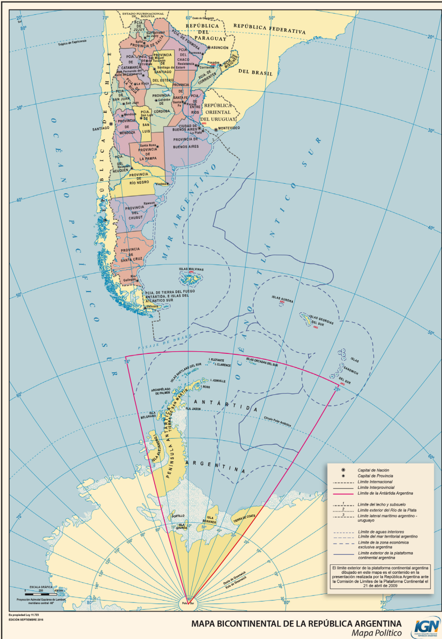
FIGURA 1 - MAPA BICONTINENTAL DE LA REPÚBLICA ARGENTINA

Fuente: IGN (Instituto Geográfico Nacional). 1