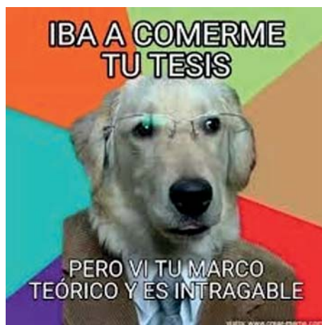
FIGURA 1 MEME SOBRE EL MARCO TEÓRICO