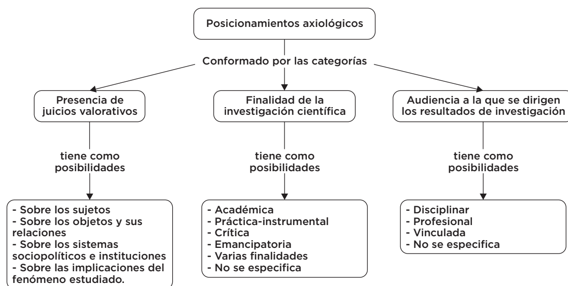
FIGURA 4 CATEGORÍAS Y POSIBILIDADES EN QUE SE DESAGREGAN LOS POSICIONAMIENTOS AXIOLÓGICOS