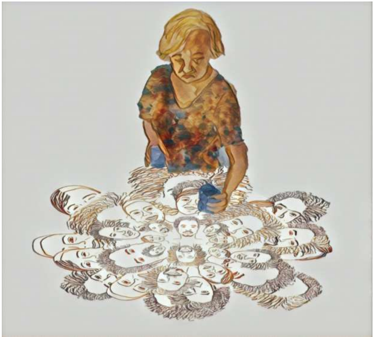
“Olly e nós”, de Adriana Nunes Souza, 2022, desenho sobre papel.