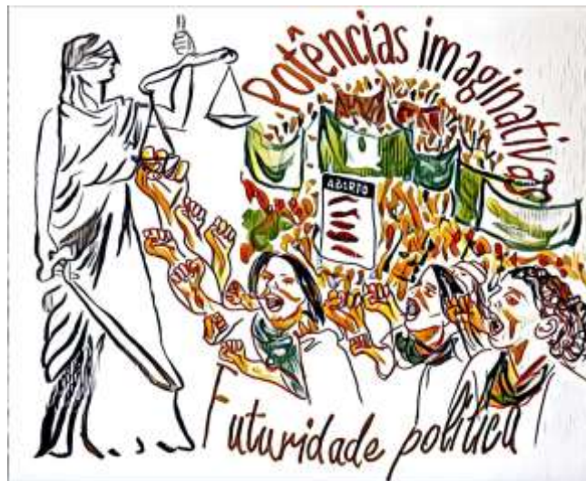
Legalismo Mágico, 2022.