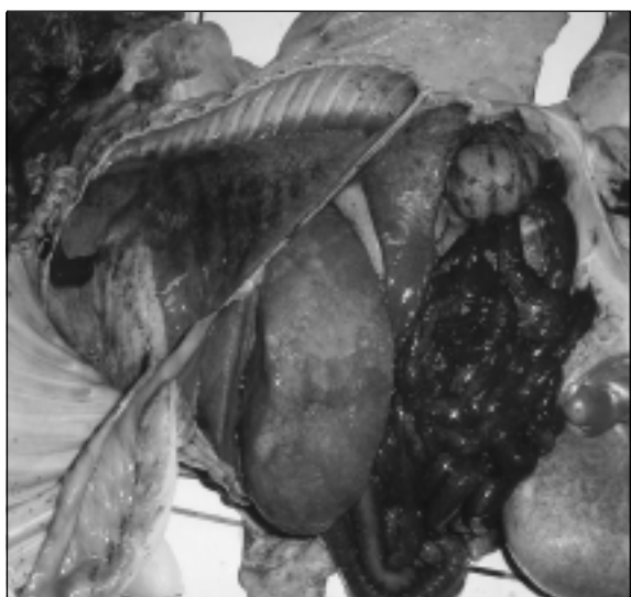
Figura 2 - Feto eqüino abortado demonstrando icterícia generalizada da carcaça, fígado de coloração amarelada, intestino difusamente avermelhado e a presença de líquido na cavidade torácica.

linfoplasmocitária difusa subaguda discreta, hemorragia peribronquiolar difusa severa e hipoplasia folicular difusa no baço. No cérebro, constatou-se hemorragia multifocal moderada com presença de neutrófilos no interior de alguns focos de hemorragia. Os cortes de rim, fígado e cérebro corados por Warthin-Starry revelaram a presença de espiroquetas de coloração enegrecida no interior dos túbulos e