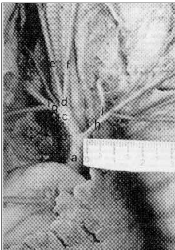
Figura 1 - Fotografia indicando as ramificações da Aorta de um feto de búfalo: Aorta (a), Tronco braquiocefálico (b), Artéria carótida comum direita (d), Artéria carótida comum esquerda (e), Artéria subclávia direita (f), Artéria axilar (h), Artéria torácica interna (i), Artéria cervical superficial (v), Tronco costocervical esquerdo (p), Artéria subclávia esquerda (q). Notar a ocorrência de origem comum (x) do tronco costocervical esquerdo com a artéria subclávia esquerda

Observou-se, em 80% dos casos estudados, que o tronco braquiocefálico emite a artéria subclávia esquerda (em origem comum ao tronco costocervical esquerdo), as artérias carótidas comum direita e comum esquerda, sem caracterizar tronco bicarotídeo, e a artéria subclávia direita (Figura 1). Já em 20% dos fetos deste estudo, observou-se que o