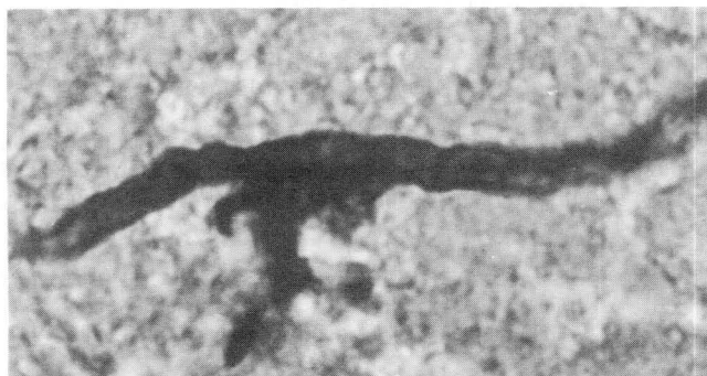
Figura 3- Corresponde a seta que indica a hifa septada e ramificada na figura 2. Obj. 100.

presença de pequeno número de hifas fúngicas semelhantes às da placenta. Os alvéolos pulmonares estavam colapsados (atelectasia fetal). No fígado havia degenerações gordurosa hepatocelular, discreta proliferação de ductos biliares e focos de hematopoese. Cordão umbilical e demais órgãos, do feto não apresentaram alterações histológicas.