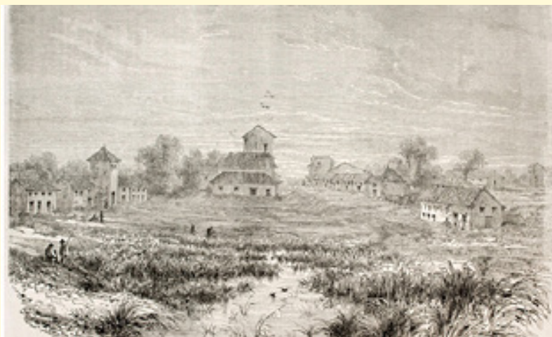
Imagem 1. Entrada da Vila da Barra do Rio Negro, entre 1848 e 1860.

Se os membros da elite político-econômica local da Barra do Rio Negro animavam-se a receber seus pares estrangeiros, vindos de terras vistas por eles como mais civilizadas, os viajantes nem sempre empreendiam a longa jornada por vontade própria. Foi o caso dos tenentes Herndon e Gibbon. Este último participou da expedição como assistente do primeiro, juntamente a meia dúzia de ajudantes, e seguiu caminho separadamente até a região oeste e sudoeste da Amazônia, bem como aos tributários bolivianos do Amazonas, compilando seu relatório no que viria a ser o segundo volume da obra. Aqui nos deteremos a abordar a trajetória do autor do primeiro volume, o tenente Herndon.