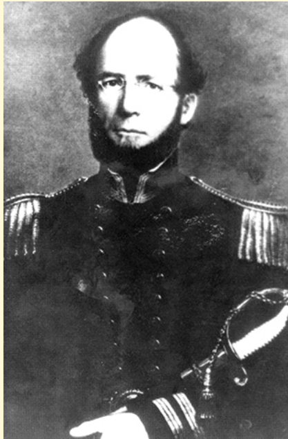
Imagem 2. Retrato do Tenente William Lewis Herndon, em c. 1853.