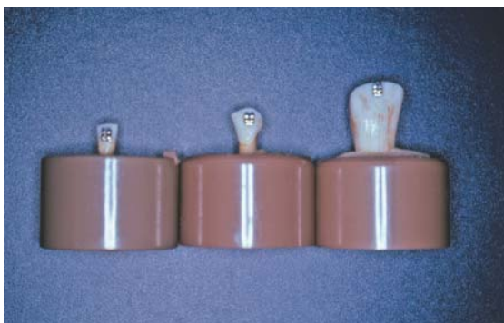
FIGURA 2 - Braquetes metálicos colados aos dentes.