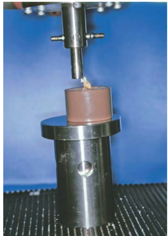
FIGURA 3 - Ensaio de cisalhamento da amostra.