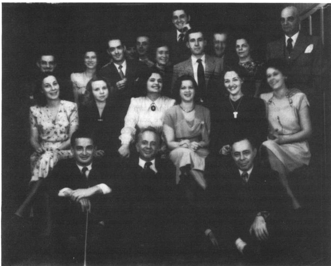
Pesquisadores do Departamento de Biologia da FFCL-USP, em 1948