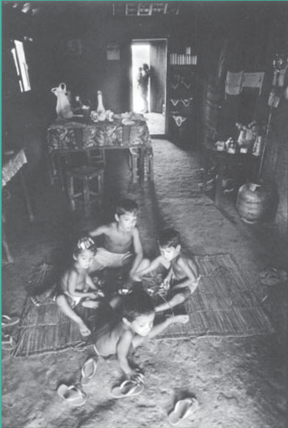
Transamazônica, Pacajá, Pará, 1994.