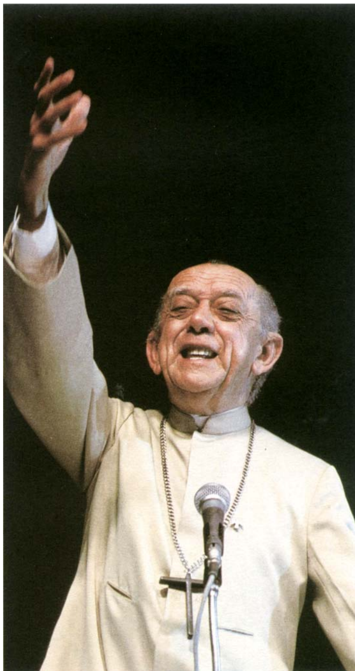
Dom Helder Câmara