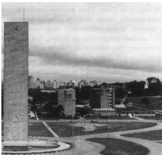
Praça do Relógio

Não posso, outrossim, deixar sem referência a nova colocação dada ao problemas das construções na cidade universitárias; "por quais razões", indaguei eu, "apesar dos recursos disponíveis, e do largo tempo transcorrido, o campus ainda permanece informe, a ponto de merecer a alcunha depreciativa dos estudantes de o matão ?". Pelo estudo que fiz da organização do Fundusp, valendo-me de minha experiência empresarial como um dos diretores da antiga Light, percebi que um grande mal o corroia, que era a burocratização de seus serviços, resultado natural da realização de obras, não por empreitada, mas valendo-se de seus próprios recursos materiais e humanos. Comparando prós e contras,