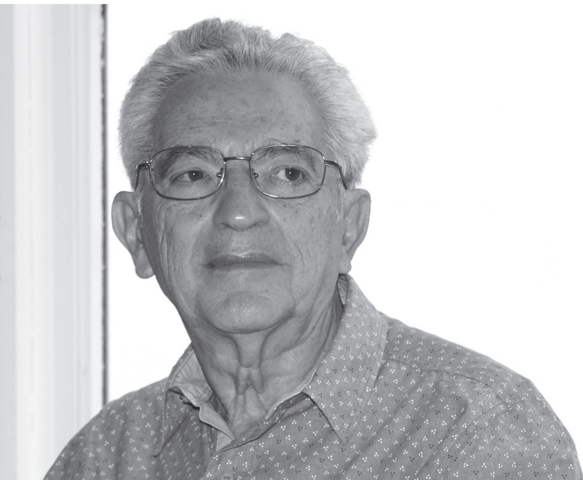
Alfredo Bosi (1936-2021).

de”. A disseminação do medo por meio do riso, o medo que “precipita-se em ódio [...] e exige castigo exemplar” (ibidem, p.318). Das singularidades do conto às especificidades do contexto, para voltar ao diagrama formal do texto. Esse é o itinerário crítico percorrido por Bosi, de conto em conto, de obra em obra.