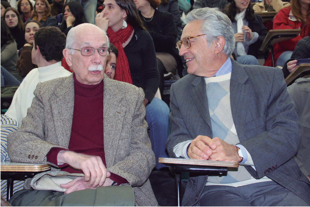
Os Professores Antonio Candido (1918-2017) e Alfredo Bosi (1936-2021) durante a “Jornada Alfredo Bosi: Cultura e Resistência”, realizado no dia 22 de agosto de 2006 na FFLCH-USP.