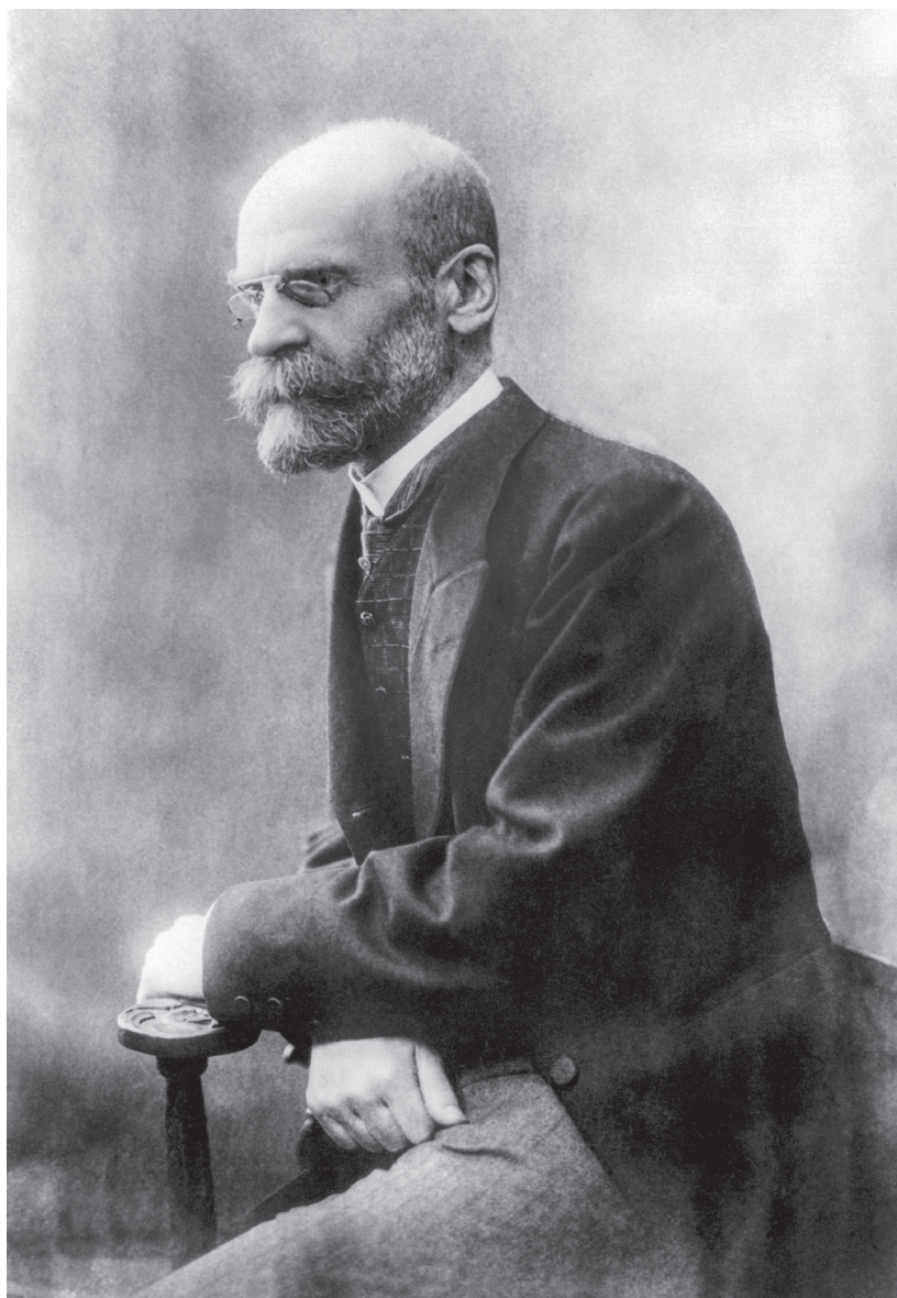
Émile Durkheim (1858-1917)

seus malefícios são muito grandes. Mas isso não o leva a prever o seu desaparecimento no curto prazo: “a civilização capitalista não desaparecerá subitamente por efeito de uma revolução; o seu decesso será precedido de um longo período de agonia” (p.281). Como “o capitalismo encarna a primeira e única civilização mundial na história... sua capacidade de resistência à mudança é incomparavelmente maior do que as civilizações que a precederam” (p.267).