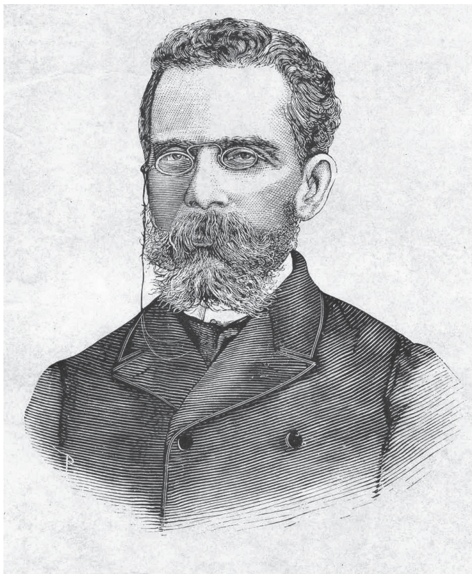
Retrato de Machado de Assis publicado no livro de Sílvio Romero.

Assim como ocorre nos romances e contos, também na correspondência as lacunas, os silêncios e os interditos muitas vezes dizem mais do que aquilo que está escrito, desafiando o leitor a ligar pontos para tentar recompor a figura prismática de Machado de Assis. As anotações copiosas e excelentes dos organizadores da correspondência, bem como a apresentação de Sergio Paulo Rouanet, servem de guia seguro e oferecem estímulo para a recomposição da trajetória desse escritor que – parafraseando aqui Drummond – continua a revolver em nós tantos enigmas.