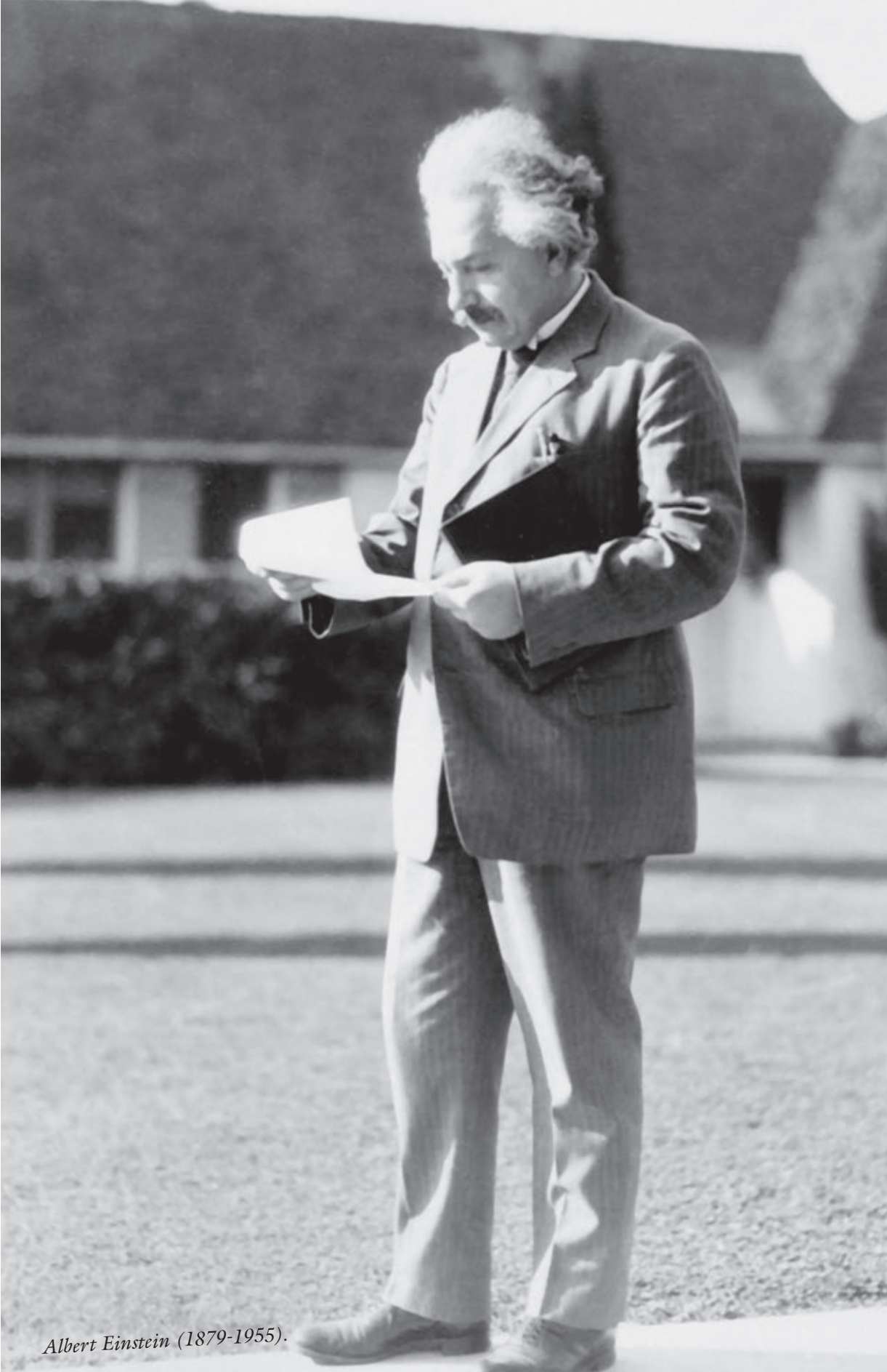
Albert Einstein (1879-1955).