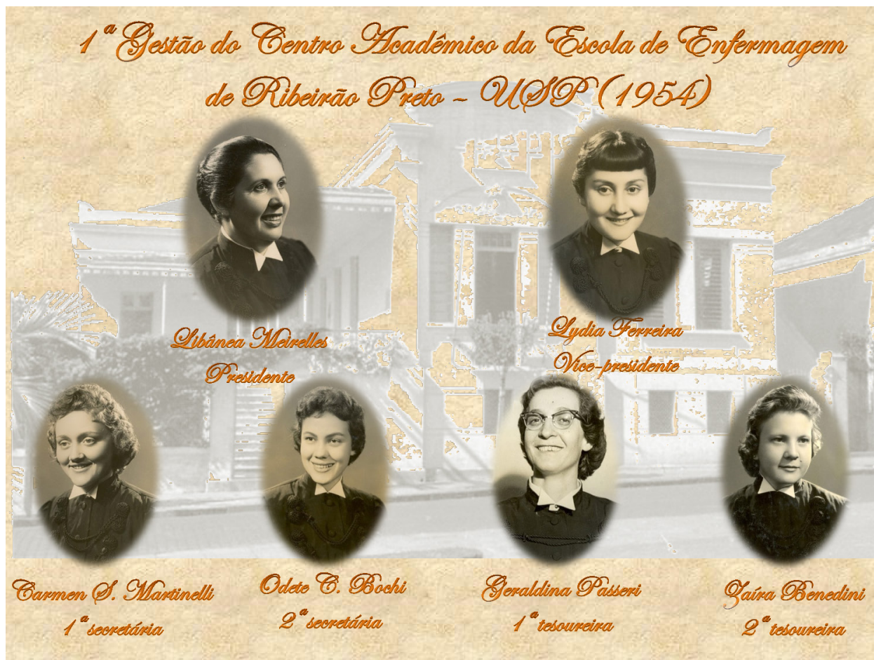
Figura 2. Primeira gestão administrativa do CAERP, 1954. Ribeirão Preto, 2022.

Ao fundo, a sede da EERP-USP em 1954. Design da montagem, usando Microsoft Office Professional Plus 2010, pelos autores