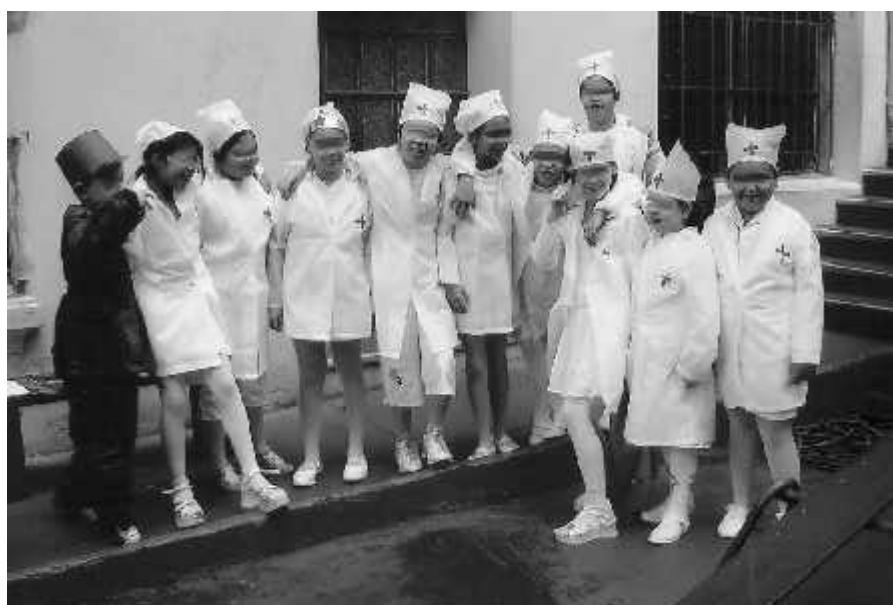
Figura 2: Alunas e alunos do Colégio São José caracterizados como enfermeiras, enfermeiros e soldados.