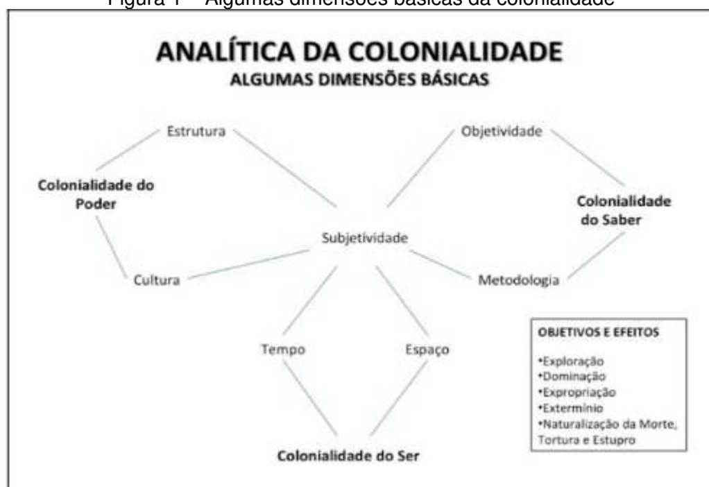
Figura 1 – Algumas dimensões básicas da colonialidade

Fonte: BERNARDINO-COSTA; MALDONADO-TORRES; GROSGOUEL (2018, p. 43).