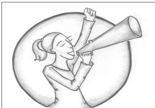
Figura 5 – Ilustração