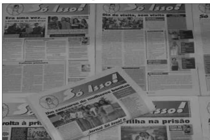
Figura 1 – Exemplos do Jornal Só Isso!

Nesse sentido, os desenhos contidos no jornal são uma importante fonte de análise, principalmente por terem sido, segundo informante 2 envolvido com o projeto, um dos motivos que geraram tensões entre a equipe do jornal e a Direção da Unidade.