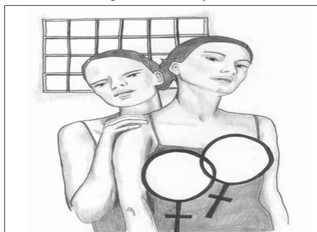
Figura 4 – Ilustração