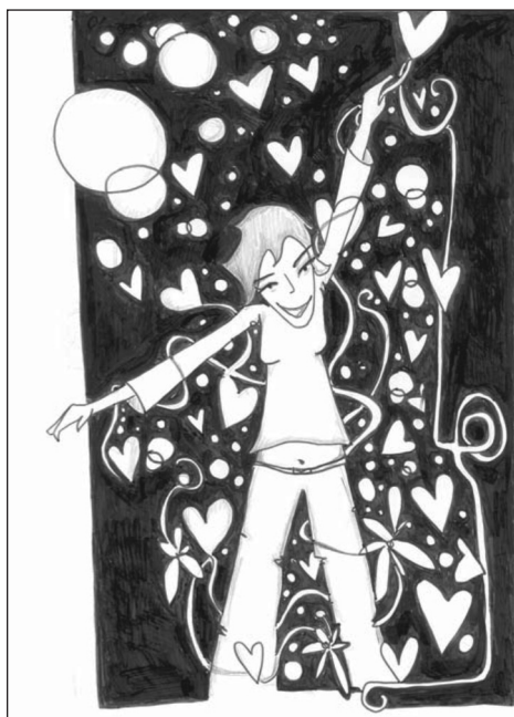
Figura 2 – Ilustração