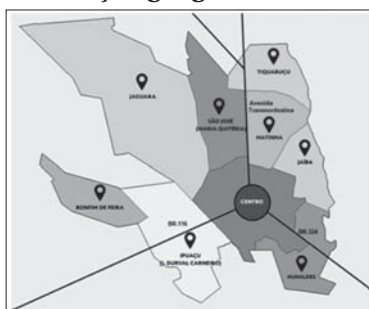
Figura 1 – Distribuição geográfica de Feira de Santana