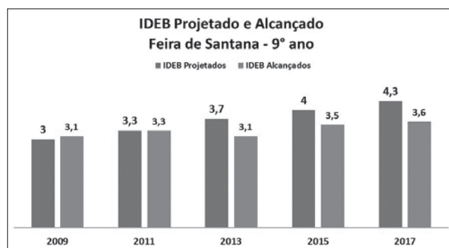
Gráfico 2 – IDEB projetado e alcançado pelas escolas municipais de Feira de Santana – 9º ano